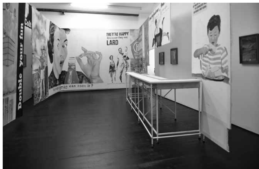
L'artiste d'origine portugaise Hugo Canoilas aime poser des questions politiques dans ses installations - à la galerie Nosbaum&Reding, jusqu'au 9 novembre.