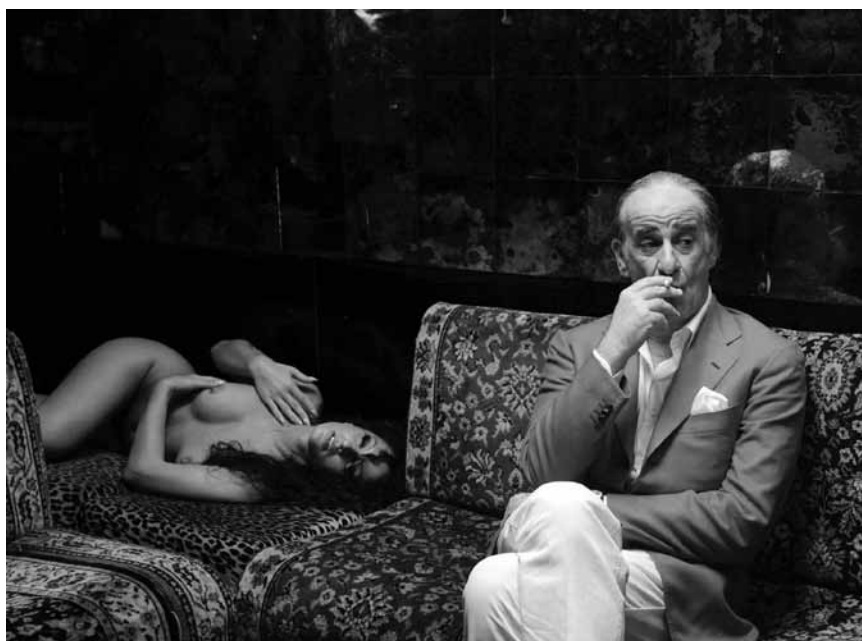
Dans « La grande bellezza », la frustration littéraire se frotte à la beauté de la Cité éternelle... Nouveau à l'Utopia.

Leben. Als es zu einigen mysteriösen Vorfällen kommt, die auf das Konto eines neuen Superschurken gehen könnten, sieht sich Gru vor neue Aufgaben gestellt - ob er will, oder nicht.