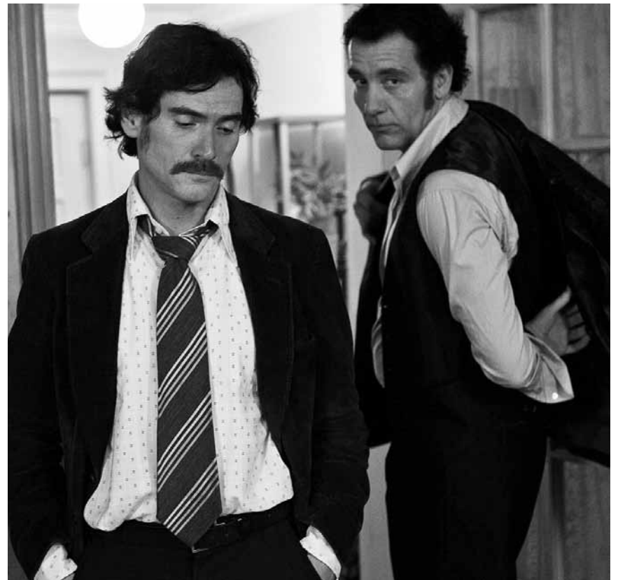
Zwei Brüder, zwei Ansichten und ein tödlicher Konflikt: „Blood Ties“, neu im Utopolis Kirchberg.

Nachdem Thor seinen Bruder Loki in die Schranken gewiesen hat, sieht er seine Aufgabe nun darin, die ins Schwanken geratene Ordnung zwischen den neun Welten wiederherzustellen. Den Konflikt mit Jotunheim konnte er gerade erst beilegen, da sieht sich der junge Gott mit einem ganz anderen Problem konfrontiert: Die uralte Rasse der Dunkel-Elfen will Thors Friedenspläne vereiteln. Deren Anführer Malekith ist älter als das Universum selbst und will dieses zurück in die Dunkelheit stürzen.