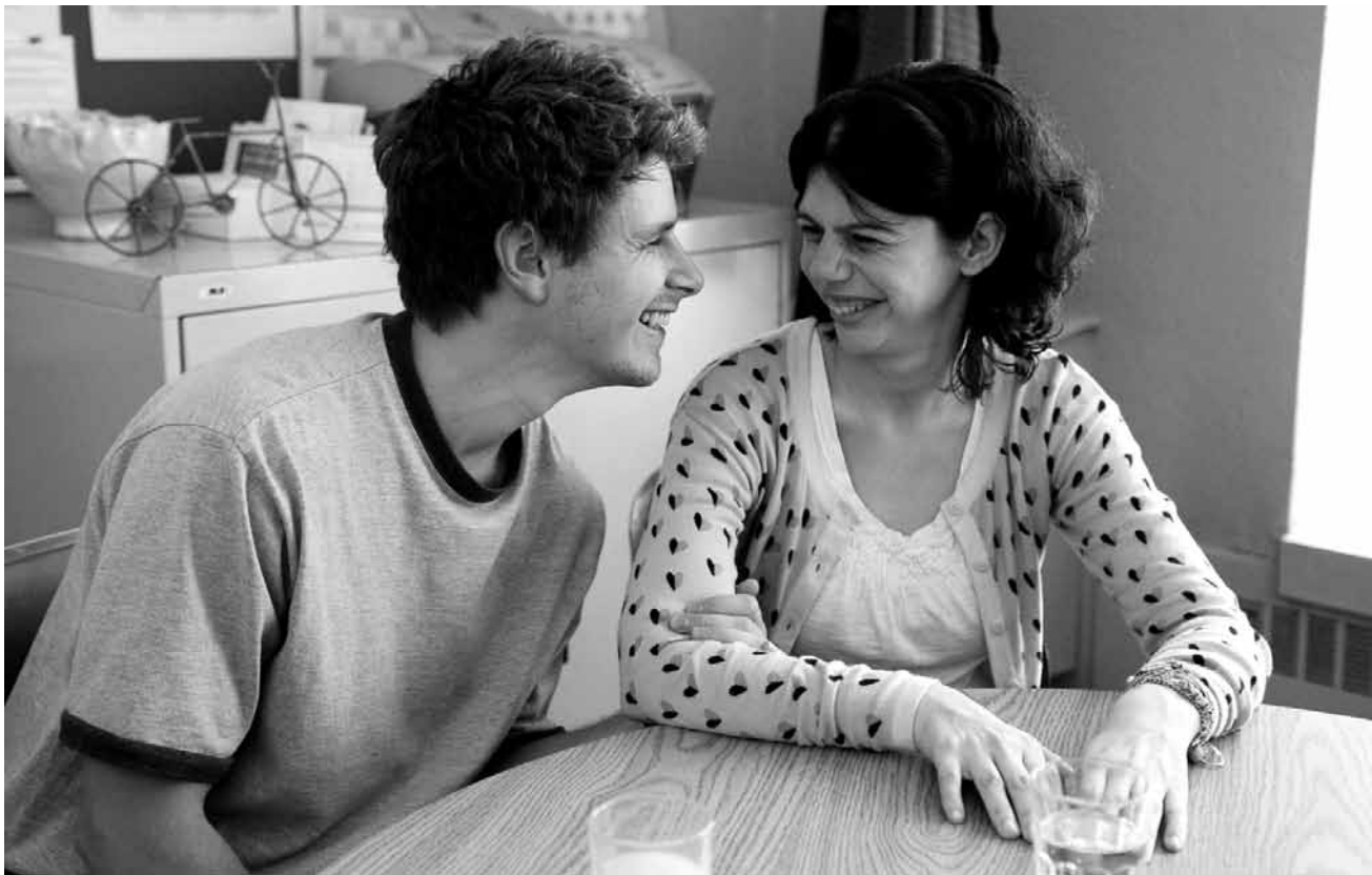
Même le handicap ne peut pas empêcher de « tomber en amour », comme on dit au Québec.