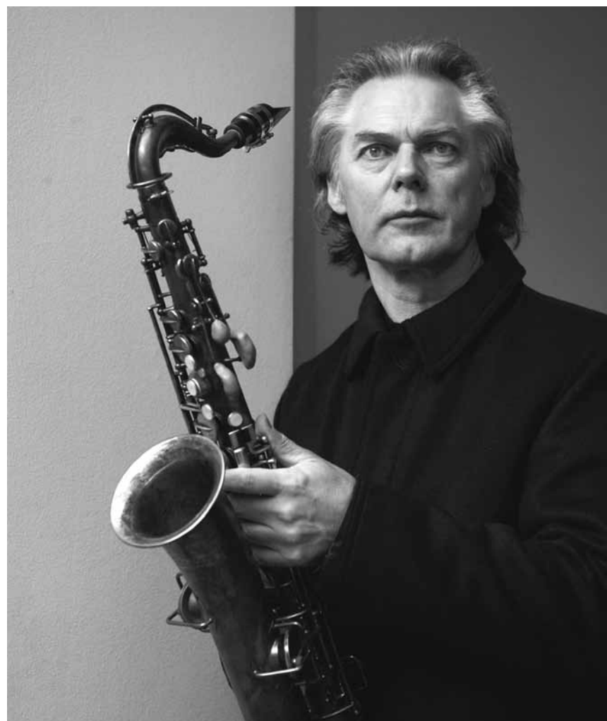
Auch Nordlichter beherrschen den Jazz, manche schon seit Jahrzehnten: Der norwegische Saxofonist Jan Garbarek gastiert am 13. November mit seiner Band und Trilok Gurtu in der Congresshalle Saarbrücken.