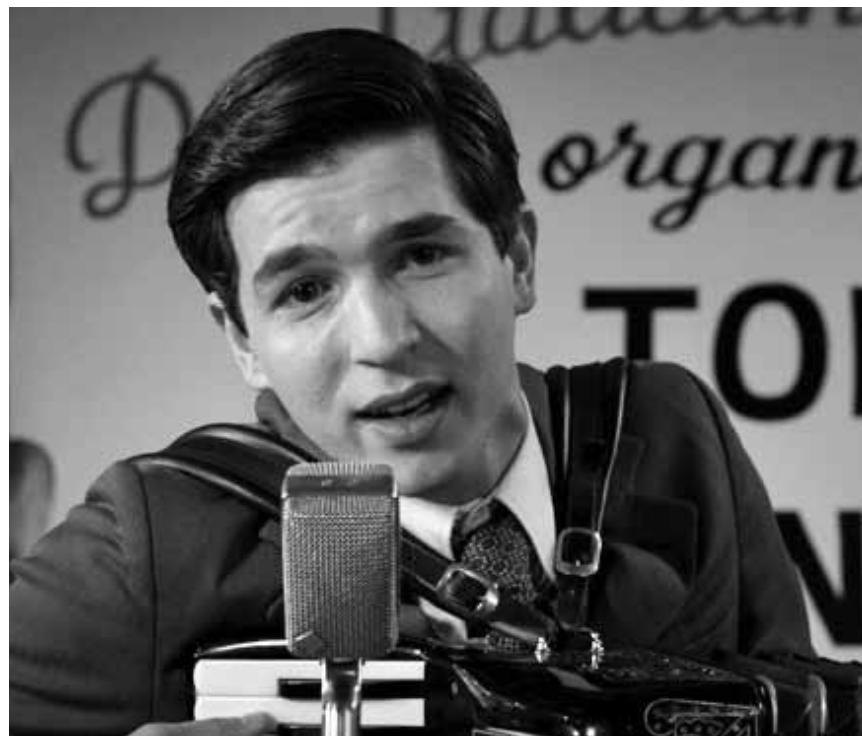
L'histoire d'une émigration compliquée et douloureuse : « Marina », de Stijn Coninx, nouveau à l'Utopia et à l'Utopolis Belval.

✘✘ Si le film est plutôt bien ficelé, il ne réflète en rien l'absence de progression dans la cause qu'il célèbre : l'avancée vers l'égalité des Noirs américains. (Ic)