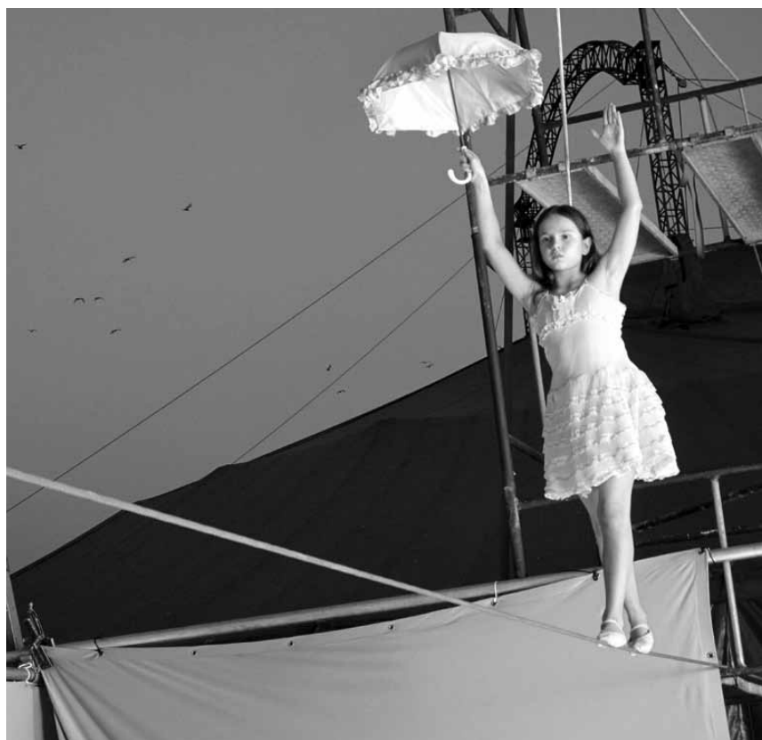
Quand la vie ne tient qu'à une seule corde : « Corda bamba », dimanche à l'Utopia, dans le cadre du festival du film brésilien.

Ariane Felder est enceinte ! C'est d'autant plus surprenant que c'est une jeune juge aux moeurs strictes et une célibataire endurcie. Mais ce qui est encore plus surprenant, c'est que d'après les tests de paternité, le père de l'enfant n'est autre que Bob, un criminel poursuivi pour une atroce