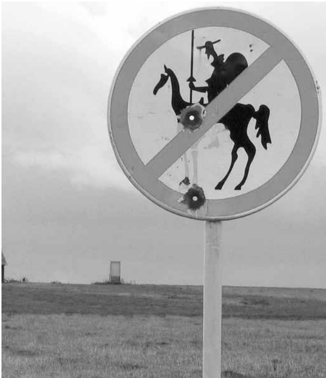
Der Don darf hier nicht rein ...