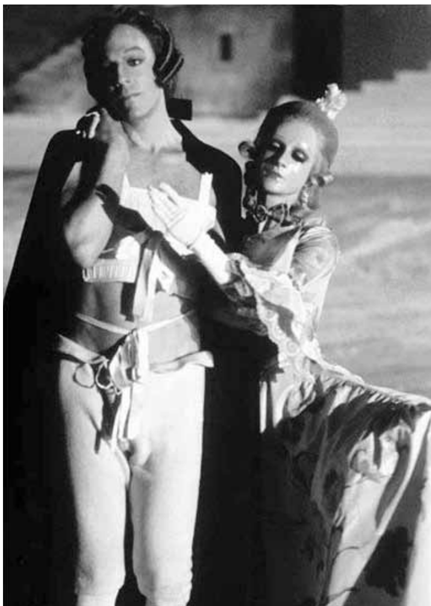
Le grand classique « Il Casanova » de Fellini sera disséqué dans le cadre de l'université populaire du cinéma et sa leçon sur le baroque, lundi prochain à la Cinémathèque.

setztes Baby findet und, zunächst widerstrebend, dann mit Überzeugung, die Rolle des Pflegevaters übernimmt.