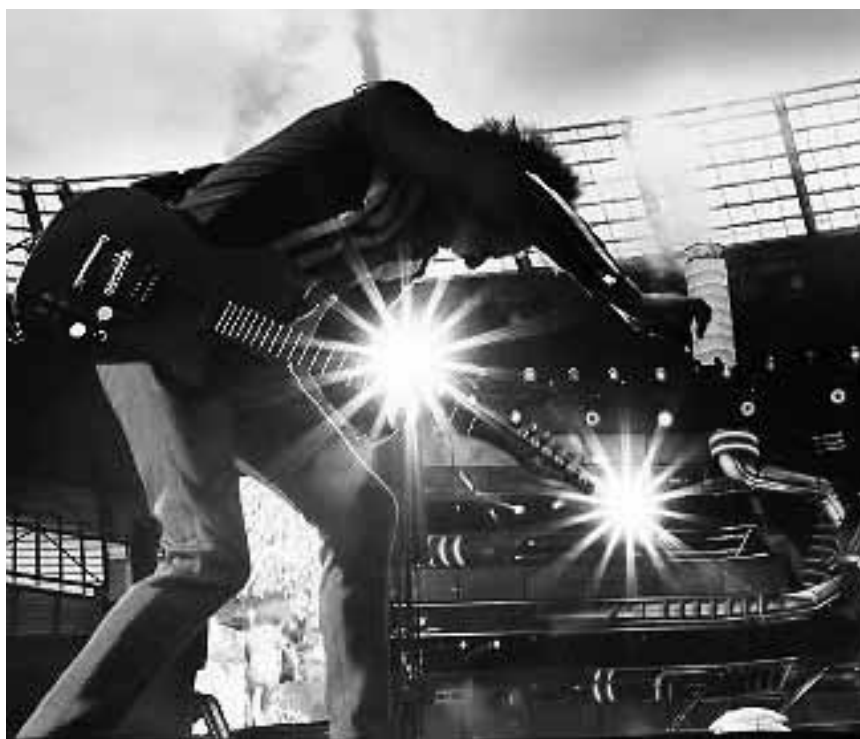
Eine Muse in schweren Zeiten: Die Bombast-Rocker aus England kann man jetzt auch auf dem hiesigen Bildschirm bewundern. „Muse - The Olympic Stadium, Rome“, am Dienstag im Utopolis Belval und Kirchberg.