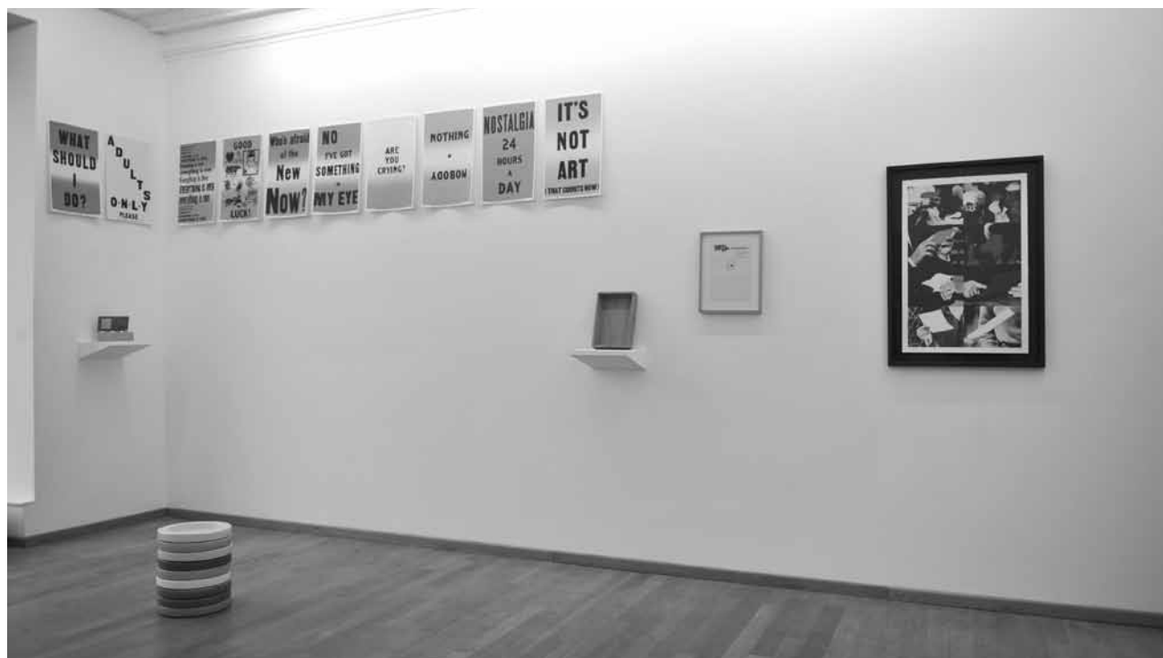
Ils n'ont pas la patate, mais la banane : « Affordable Bananas or Whatever », exposition collective à la galerie Nosbaum & Reding - jusqu'au 11 novembre.