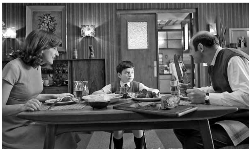
Le classique de Sempé prend vie dans « Le petit Nicolas », ce dimanche à la Cinémathèque.

konfrontiert, die kopfüber an einem Baum hängen. Es herrscht allerhöchste Alarmbereitschaft. Das ist auch gut so, denn tief im Dickicht der Blätter lauert eine unsichtbare Bestie.