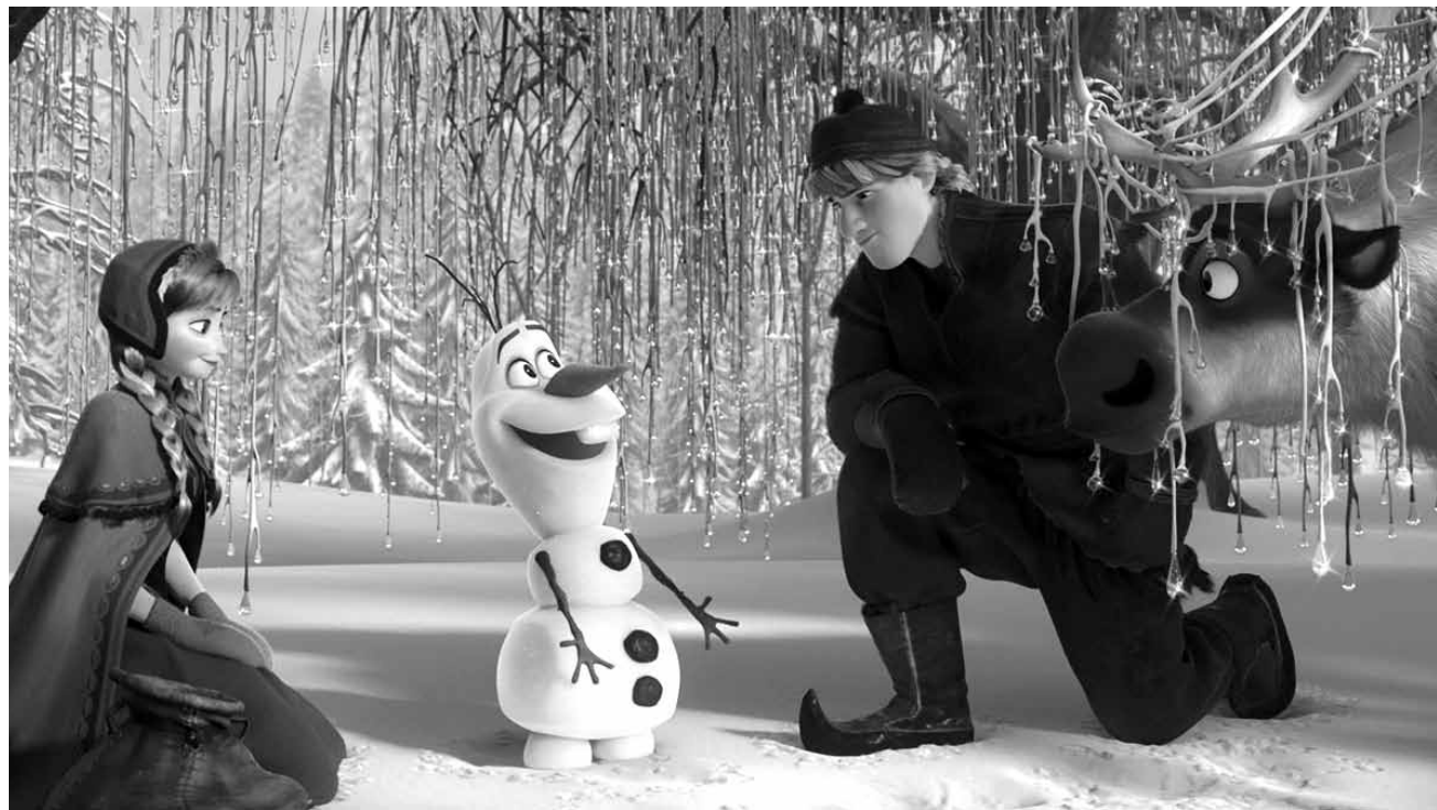
Ewiger Frost sucht das Königreich Arendelle heim. Ein ungleiches Team, mit trotteligem Schneemann, muss des Rätsels Lösung finden: „Frozen“, neu in den Kinos und am Sonntag im Ciné Breakfast im Utopia und im Sura.

Durch eine Prophezeiung fällt das Königreich Arendelle in einen ewig währenden Winter. Um gegen das kalte Schicksal des Reichs anzukämpfen und den Frostzauber aufzuheben, schließt sich die Königstochter Anna mit dem schroffen Kristoff zusammen, einem