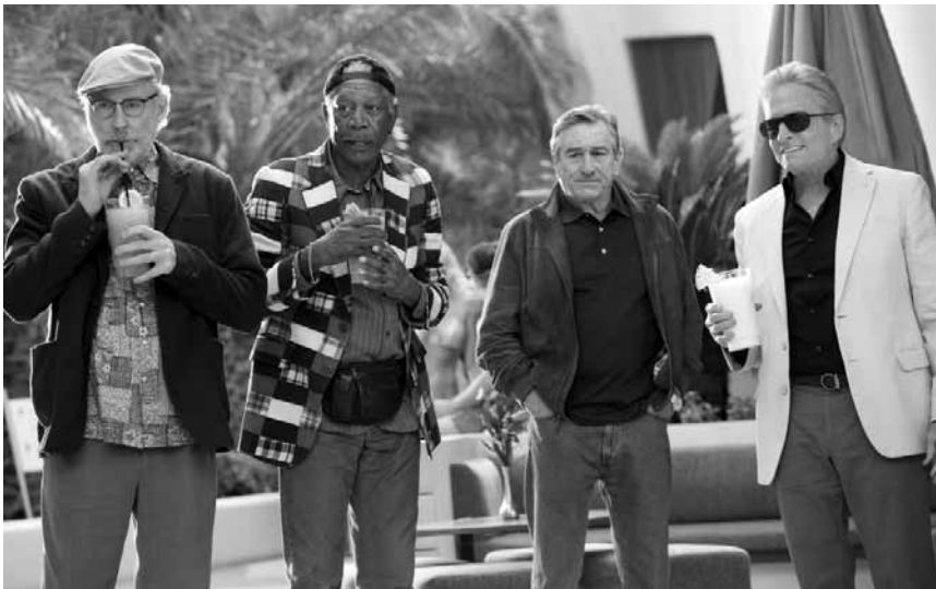
Ältere Männerrunde auf der Suche nach ihrer Jugend während einer Junggesellenabschiedstour: „Last Vegas“, neu im Kursaal, im Utopolis Belval und Kirchberg.

schläft es zurückgezogen auf dem Dachboden, doch nachts erwacht es und zieht durch die Gänge. Eigentlich ist sein größter Wunsch, die Welt einmal bei Tageslicht zu sehen. Als eines Tages der Schüler Karl mit seiner Klasse eine Nachtwanderung durch Burg Eulenstein macht, kommt es zu einer folgenschweren Begegnung.