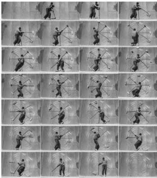
L'art de Robin Rhode se situe entre performance et autoportrait.