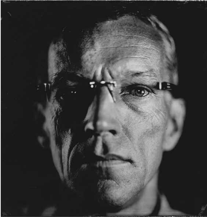
...qui a utilisé un collodion - une des plus anciennes techniques photographiques, développée au 19e siècle. L'exposition au CNA durera jusqu'au 14 décembre.