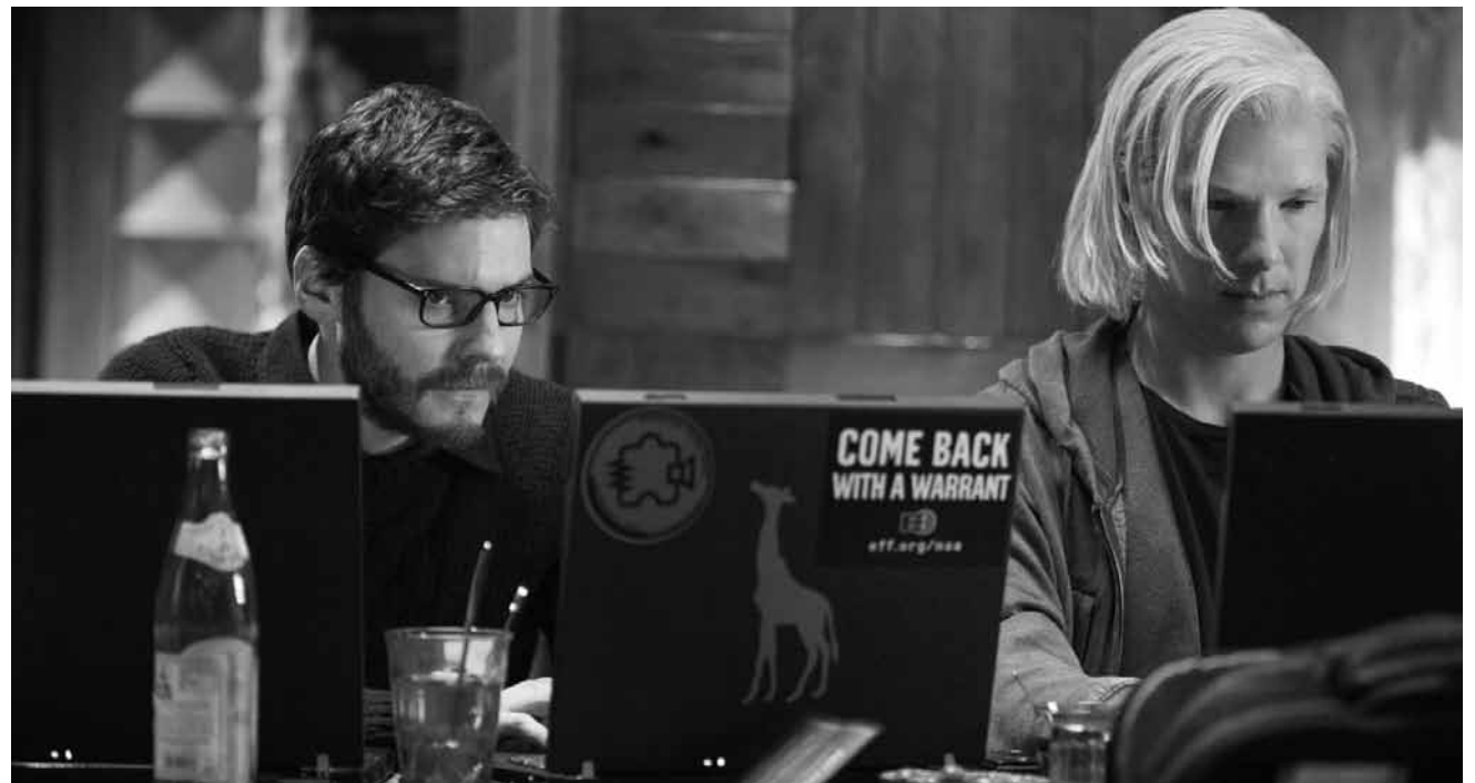
Julian Assange ist noch nicht mal tot, hat aber schon einen Biopic: „The Fifth Estate“ erzählt die bewegte Geschichte von Wikileaks. Neu im Utopolis Kirchberg.

Durch eine Prophezeiung fällt das Königreich Arendelle in einen ewig währenden Winter. Um gegen das kalte Schicksal des Reichs anzukämpfen und den Frostzauber aufzuheben, schließt sich die Königstochter Anna mit dem schroffen Kristoff zusammen, einem draufgängerischen Bergbewohner. Zusätzlich stehen ihnen noch das treue Rentier Sven und der tollpatschige Schneemann Olaf zur Seite. Ihr Vorhaben kann ihnen nur gelingen, wenn sie Annas Schwester Elsa, die mittlerweile als Schneekönigin bekannt ist, ausfindig machen und besiegen.