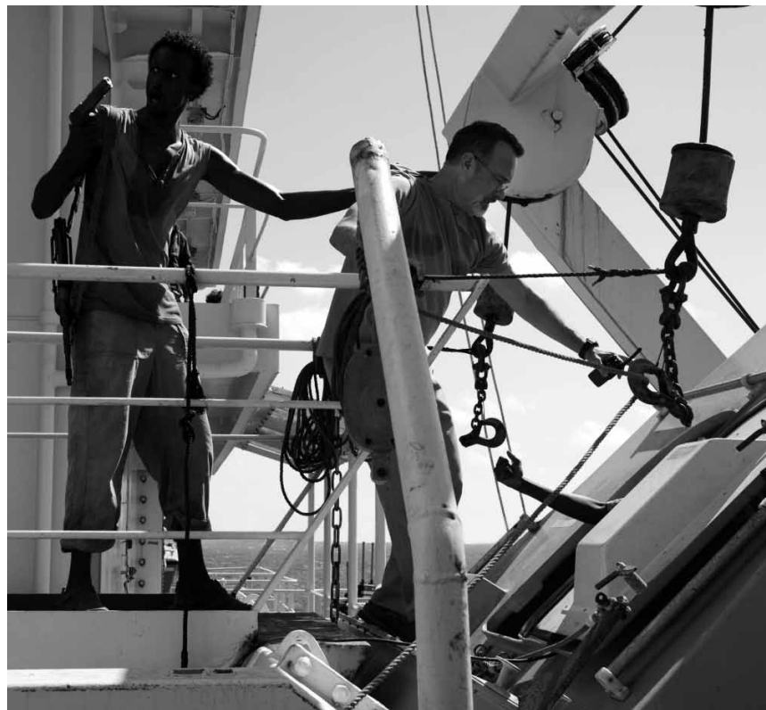
Ein Piratenfilm, aber bestimmt kein lustiger ... „Captain Philipps“, mit Tom Hanks. Neu in den Kinos.

Peeta und Katniss haben die gefährlichen Hungerspiele überlebt. Die grausame Regierung unter Präsident Snow zwingt die beiden Gewinner jedoch, für Propagandazwecke zu posieren