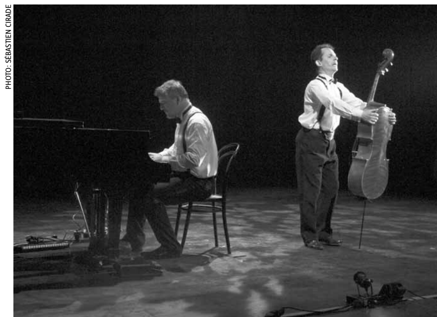
Une confrontation burlesque et musicale : « Duel », concert-théâtre, ce dimanche 8 décembre à la Schungfabrik à Tétange.

Juillet , texte d'Ivan Viripaev, mise en voix par Vincent Goethals, Théâtre du Centaure, Luxembourg, 18h30. Tél. 22 28 28.