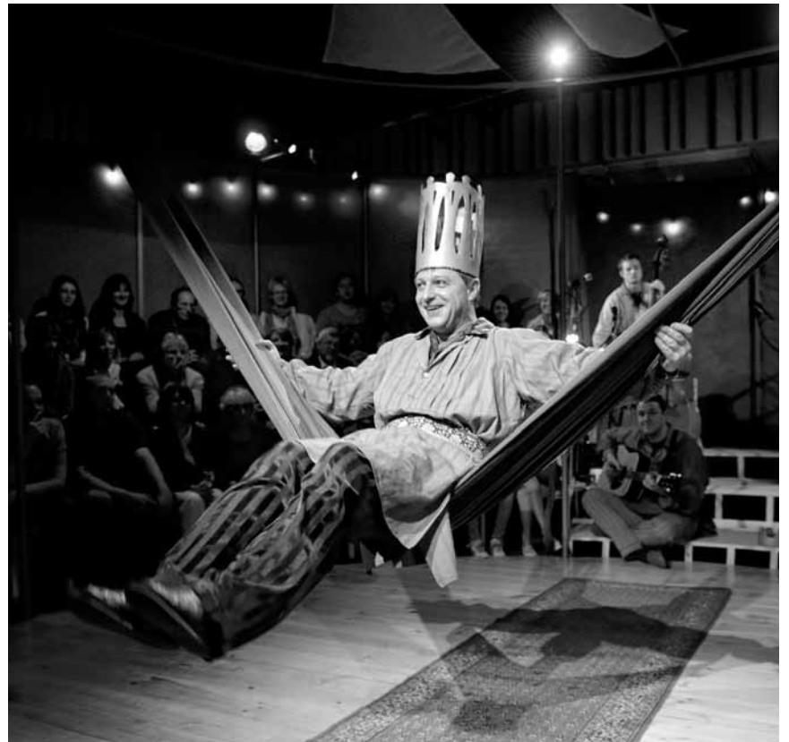
Royales Vergnügen für die Kleinen verspricht „Der König ohne Reich“ von Marcel Cramer - an diesem Sonntag, dem 8. Dezember im Mierscher Kulturhaus.