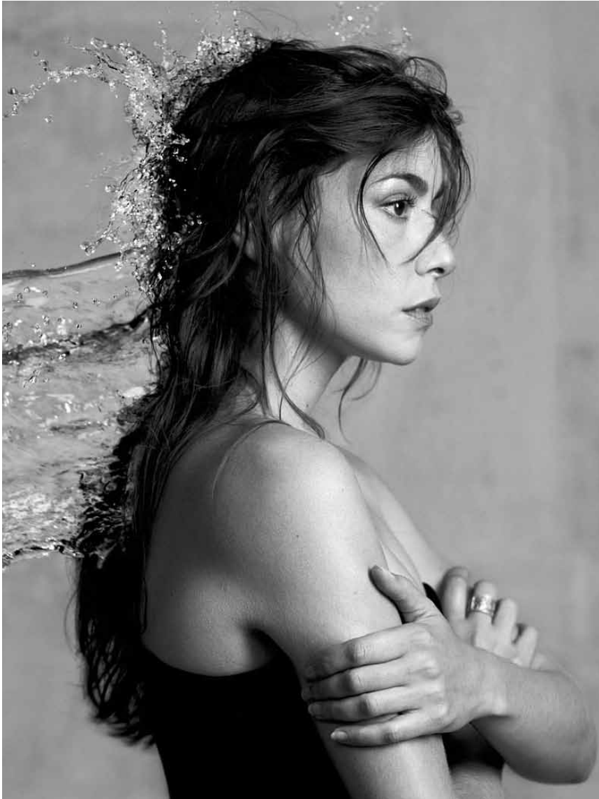
La chanteuse et actrice française Olivia Ruiz apparaîtra à la Maison de la Culture d'Arlon, le 10 décembre.

Klimawandel: Fakten statt Ablenkungsmanöver! Vortrag von Prof. Dr. Mojib Latif, Parc Bellevue, Centre Convict, Luxembourg , 19h30.