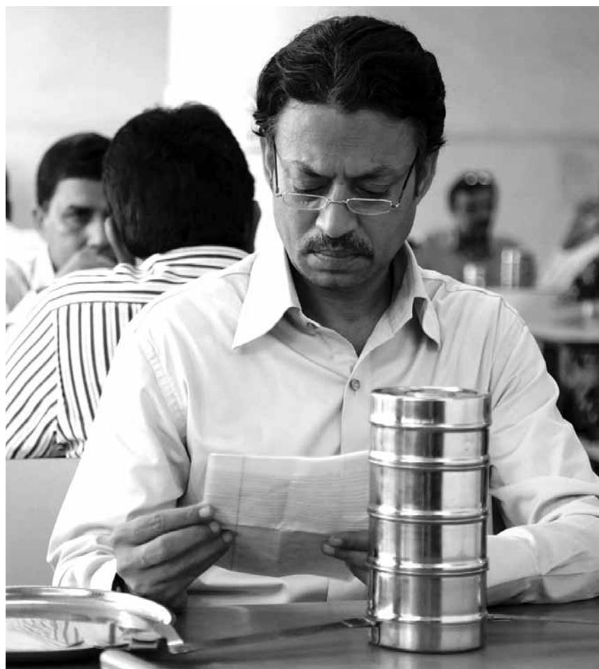
Wie ein verwechseltes Fresspaket eine neue Liebe entflammt, kann man in „The Lunchbox“ sehen. Neu im Utopia.

✘ Malgré quelques longueurs, ce thriller est captivant, mais l'histoire est un peu trop tirée par les cheveux. (lg)