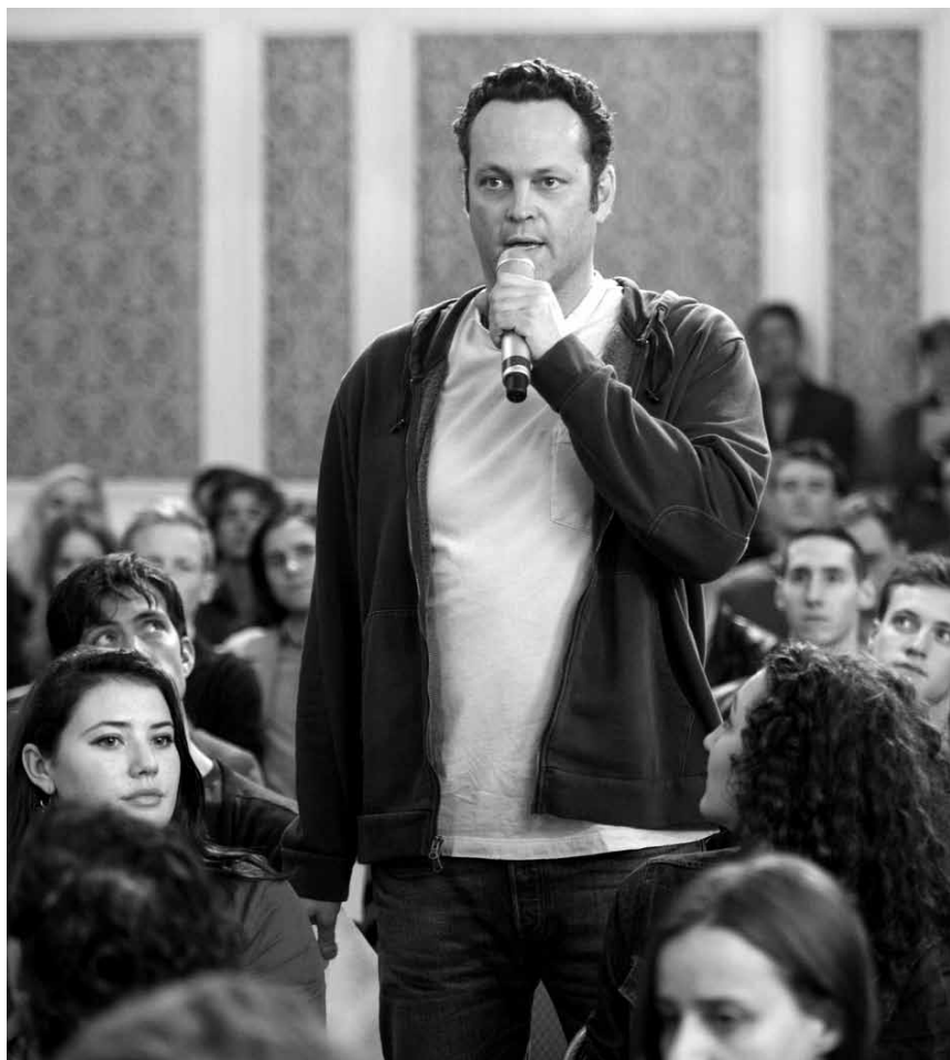
Unverhofft kommt oft: Der Loser David Wozniak erfährt, dass er seit 20 Jahren Vater von 533 Kindern ist. „Delivery Man“, neu im Utopolis Kirchberg.

XXX Exploration brillante des rapports entre hommes et femmes. (lc)