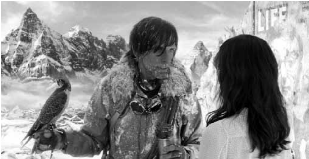
Sich Träume verwirklichen, das kann auch mal zu gefrorenen Bärten führen...