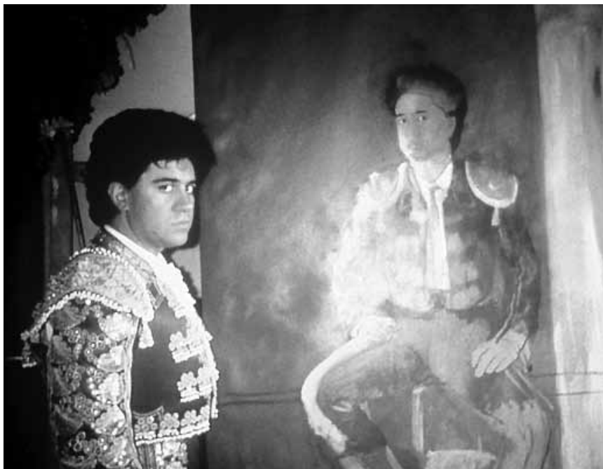
« Matador » est un vieux chef-d'oeuvre de Pedro Almodovar, plein de crimes, de sang et de passion macabre. Jeudi à la Cinémathèque.