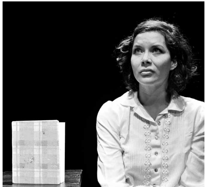
Fabienne Elaine Hollwege erweckt in „Das Tagebuch der Anne Frank“ eine der wichtigsten Zeitzeuginnen des Holocausts zu neuem Leben. Am 9. und am 10. Januar im Escher Theater.