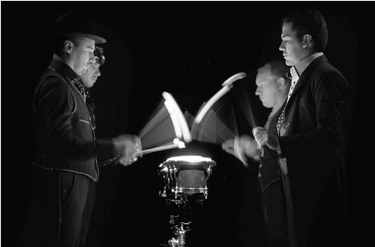
Musiciens et acteurs en même temps : le « Quatuor Beat ».