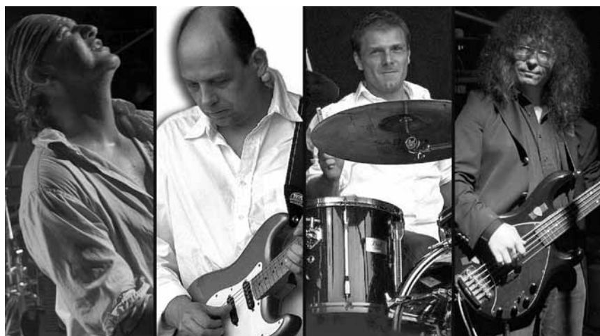
Frères d'armes tributaires des Dire Straits - les « Brothers in Arms » couvriront les tubes du groupe mythique, les 3 et le 4 janvier au Spirit of 66 à Verviers.

Le prince , d'après Machiavel, Grand Théâtre, Luxembourg , 20h. Tél. 47 08 95-1.