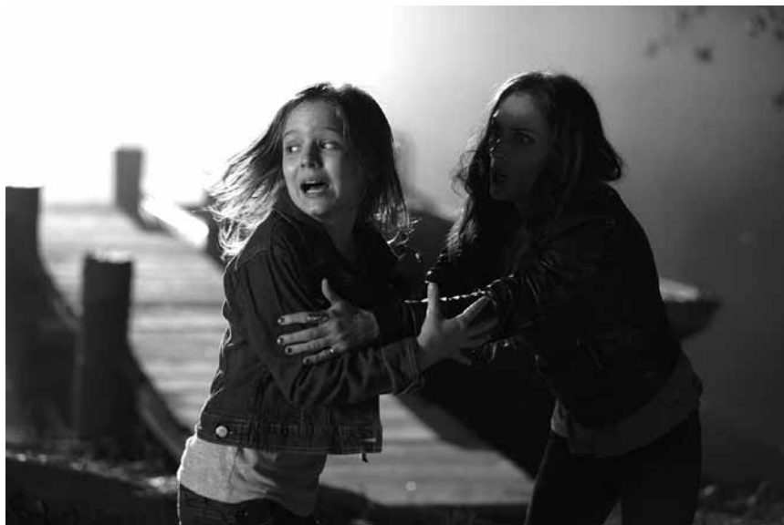
Wenn Sylvester Stallone ein Drehbuch schreibt dann muss es knallen ... „Homefront“, neu im Utopolis Kirchberg und Belval.

wird er allerdings als neuer Aushilfslehrer eingestellt – und sieht sich nun mit chaotischen Schülern und seiner unsicheren Kollegin Lisi Schnabelstedt konfrontiert.