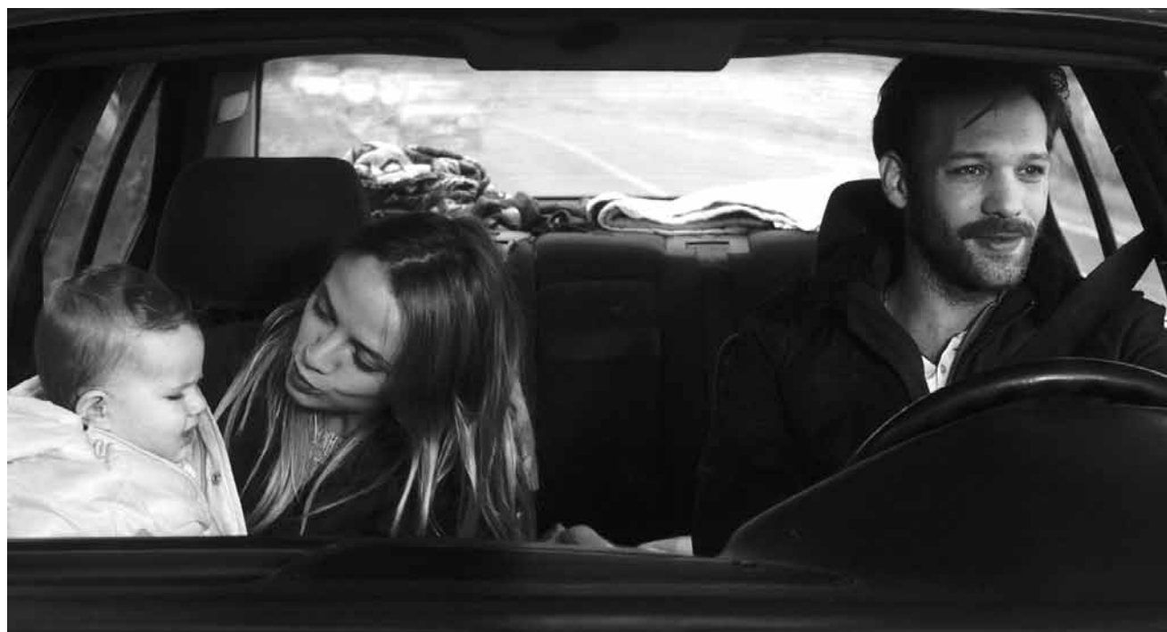
L'histoire de « Suzanne » est une tragédie entre adolescence, maternité et amour fou. Nouveau à l'Utopia.

✘ Malgré quelques longueurs, ce thriller est captivant, mais l'histoire est un peu trop tirée par les cheveux. (lg)