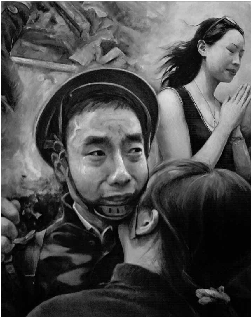
Le centre culturel de rencontre Abbaye de Neumünster consacre ce début d'année au deuxième volet de « L'art contemporain chinois », à partir du 18 janvier et jusqu'au 9 février.