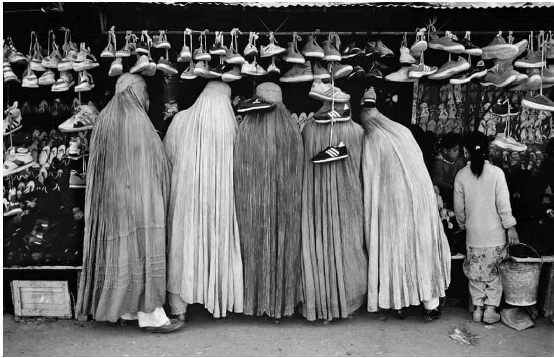
Markt in Afghanistan