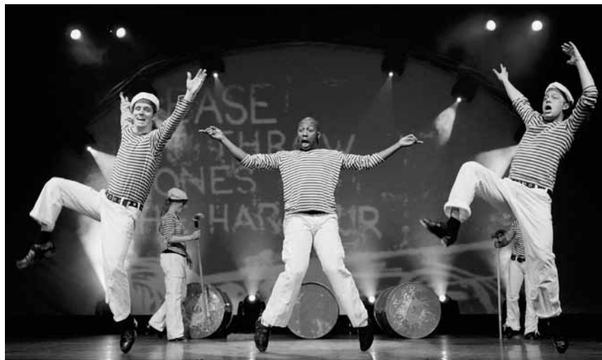
Irishes Tanzspektakel der Extraklasse: „Magic of the Dance“ - an diesem Freitag, dem 10. Januar in der Sporthalle in Oberkorn.

Kröhnerts Krönung , Kabarett, Kultur-Salon bei den Winzern, Saarbrücken (D), 21h. Tel. 0049 681 58 38 16.