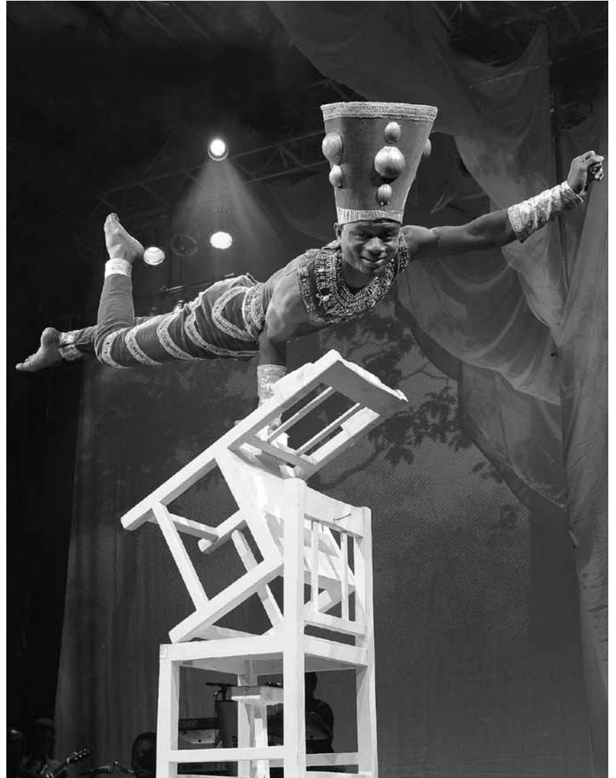
Großer Zirkus und vor allem: ohne dressierte Tiere. „Mother Africa“ gastiert an diesem Sonntag, dem 12. Januar in der Saarlandhalle in Saarbrücken.