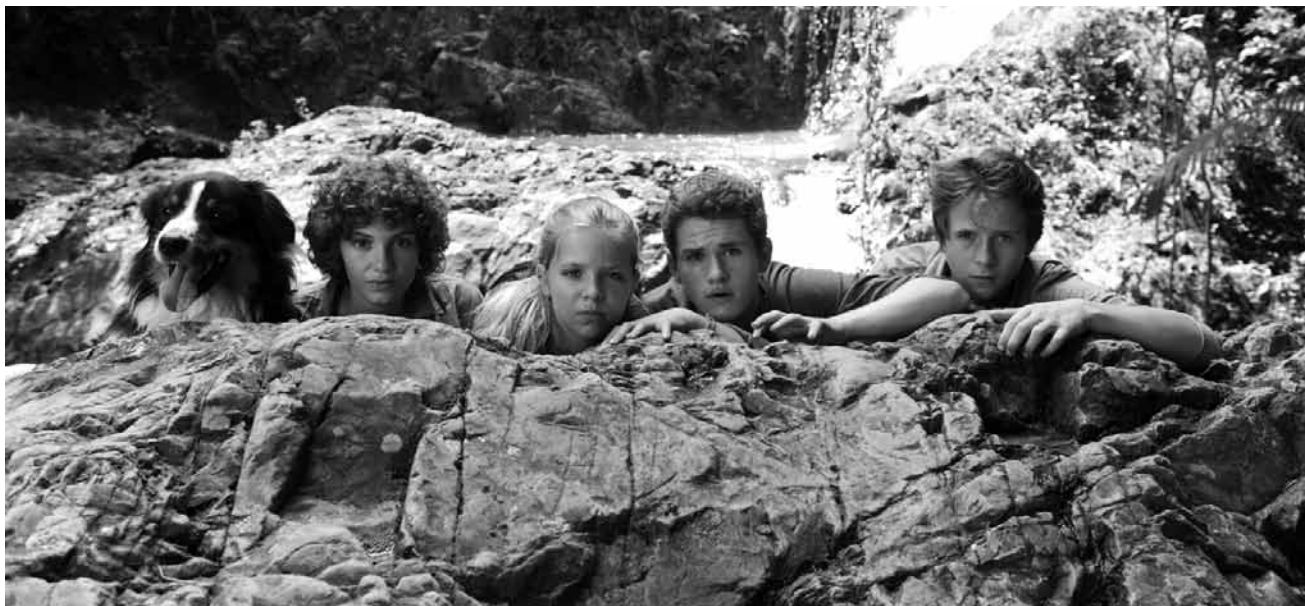
Diesmal stoßen die jungen Hobbydetektive auf ein versunkenes Schiff: „Fünf Freunde 3“, neu im Utopolis Kirchberg.

Magazins. Dem grauen Alltag versucht Walter durch Tagträume zu entfliehen, in denen er heldenhafte Abenteuer erlebt und die ganz große Liebe findet. Doch dann begegnet er seiner neuen Kollegin Cheryl und plötzlich ist die große Liebe Realität geworden. Doch Walter traut sich nicht, Cheryl anzusprechen.