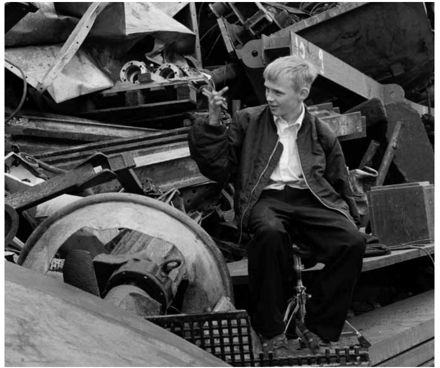
Das englische Sozialkino ist weit mehr als Ken Loach, wie Clio Barnards „The Selfish Giant“, eindrucksvoll beweist. Neu im Utopia.