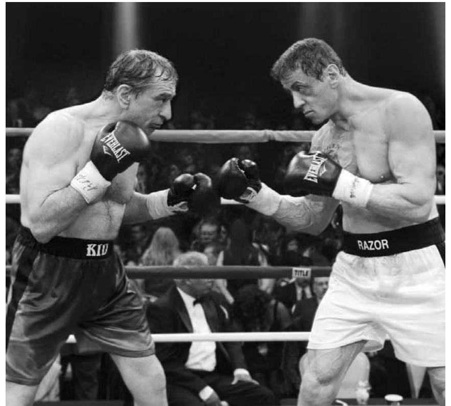
Feste druff! In „Grudge Match“ dürfen Sylvester Stallone und Robert De Niro noch mal die Boxhandschuhe anziehen. Neu im Utopolis Belval und Kirchberg.