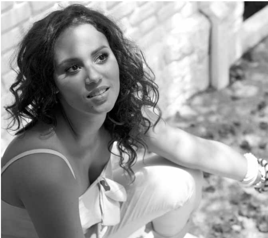
La grande star du Cap-Vert, Mayra Andrade, enchantera la grande salle de la Kulturfabrik, le 25 janvier.

la Madelonne, Sterpigny (B) , 21h. Tél. 0032 80 51 77 69.