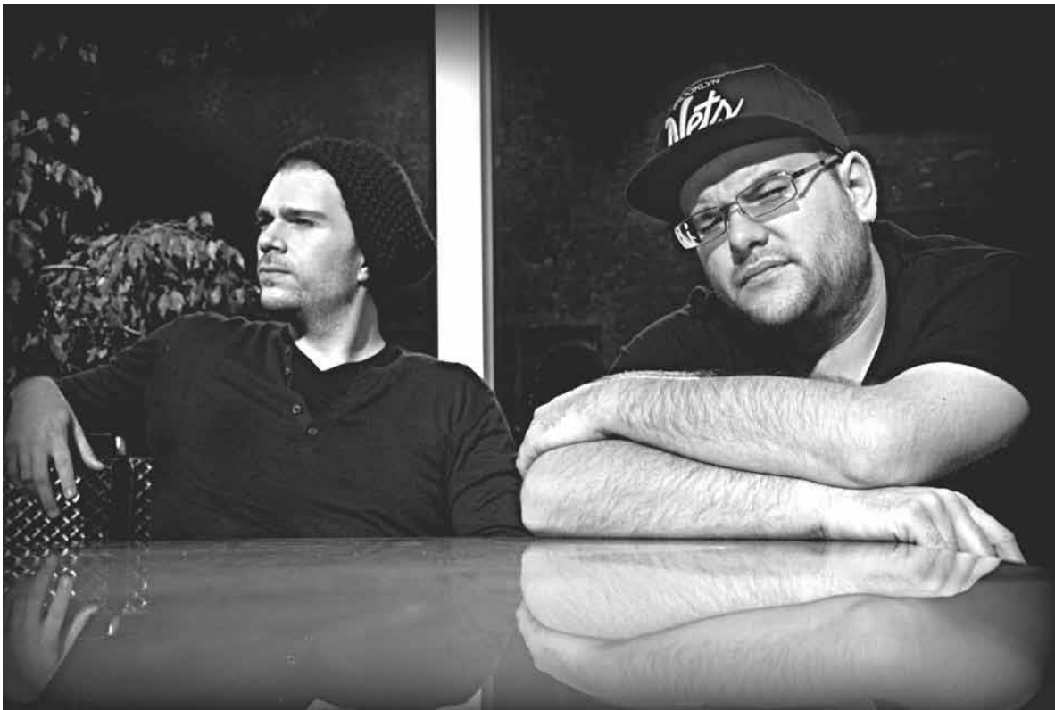
Sur la photo, c'est vrai, ils n'ont pas l'air très frais - raison de plus de venir découvrir Freshdax en live.