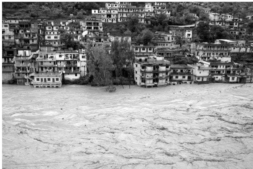
Die Wanderausstellung „Wir sind alle Zeugen - Menschen im Klimawandel“ - ist noch bis zum 2. Februar im Moutforter Jugendhaus zu sehen.