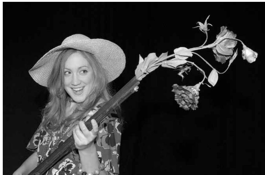
Ein Experiment mit faschistischen Verhaltensmustern geht gründlich schief: „The Wave“ nach Morton Rhue, am 27. und am 28. Januar in der Abtei Neumünster.

En passant... , textes et chansons par Michel Clees et ensemble, Kulturfabrik, Esch , 20h. Tél. 55 44 93-1.