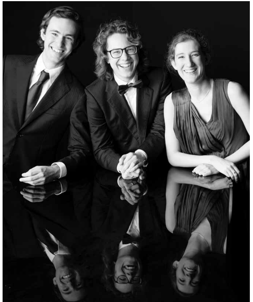
Originaire des Pays-Bas, le « Van Baerle Trio » jouera des oeuvres de Haydn, Brahms, Martin et Dvorak, ce vendredi 24 janvier à la Philharmonie.