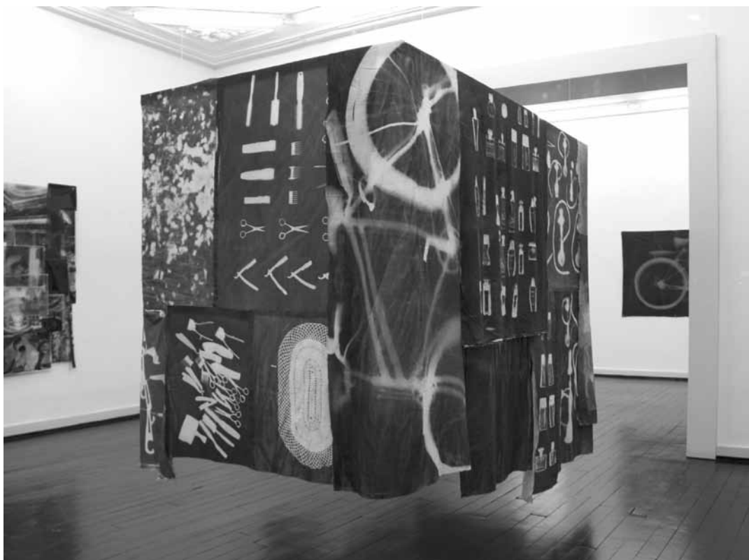
L'installation « 1725 Sozak, No. 43 »