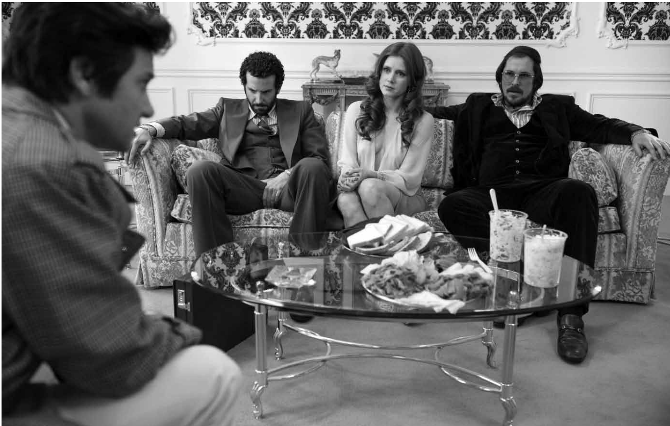
Les escrocs escroqués escroquent aussi le public.