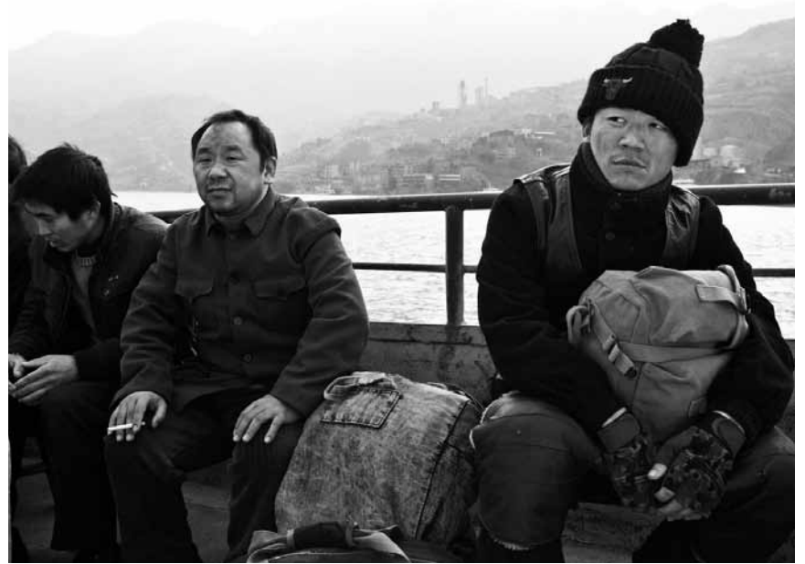
„Touch of Sin“, der neue Film von Jia Zhang Ke, der als einer von Chinas größten Regisseuren gilt, prangert die Korruption in Nordchina an. Am Samstag im Utopia, im Rahmen von „Asian Masterpieces“