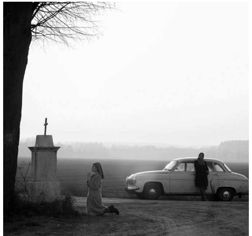
Das Drama „Ida“ von Regisseur Pavel Pawlikowski stellt, ganz in Schwarz-Weiß, die Frage ob Religion, identitätsstiftend sein kann. Neu im Utopia.