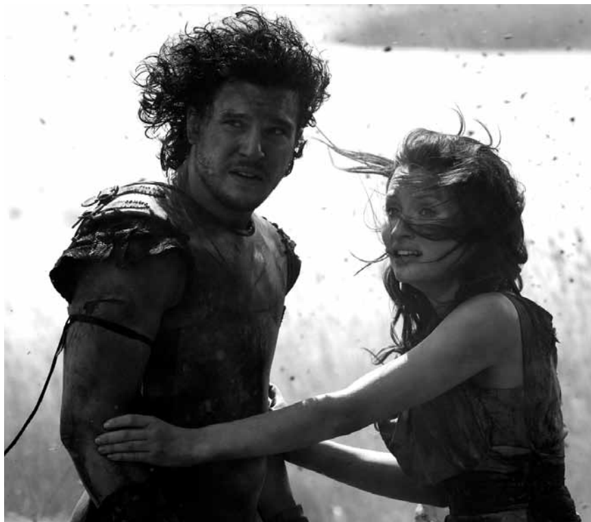
„Pompeii“ von Paul W.S. Anderson ist eine freie fiktive Interpretation der größten Naturkatastrophe aller Zeiten. Neu im Utopolis.