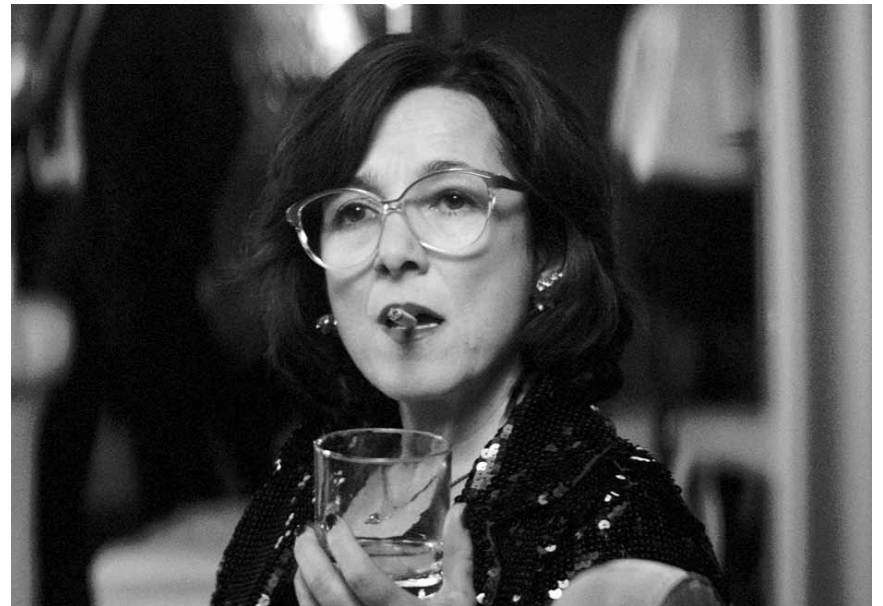
Jung ist man vor allem im Kopf! „Gloria“ von Sebastian Lelio ist eine Hymne an die Lebensfreude (und die Liebe). Neu im Utopia.