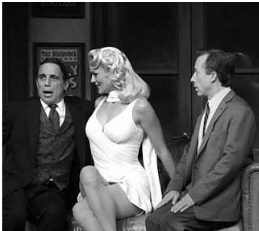
Le Kinosch propose de revoir ce vendredi la comédie de Mel Brooks „The Producers“, dont l'humour n'a pas pris une ride.

Ila lebt in der indischen Metropole Mumbai. Seit geraumer Zeit wird sie von ihrem Mann vernachlässigt und genau das beabsichtigt sie mittels ihrer würzigen Kochkunst zu ändern. Sie zaubert ihrem Gatten köstliche Mahlzeiten, die sie ihm durch sogenannte Dabbawallas zukommen lassen will. Diese Lieferanten haben sich darauf spezialisiert, Büroangestellten das frisch zu Hause zubereitete Mittagessen direkt an den Arbeitsplatz zu bringen. Doch bei der Lieferung an Ila's Mann geht etwas schief, die Essensbox landet trotz überaus penibler Kennzeichnung nicht dort, wo sie hin soll