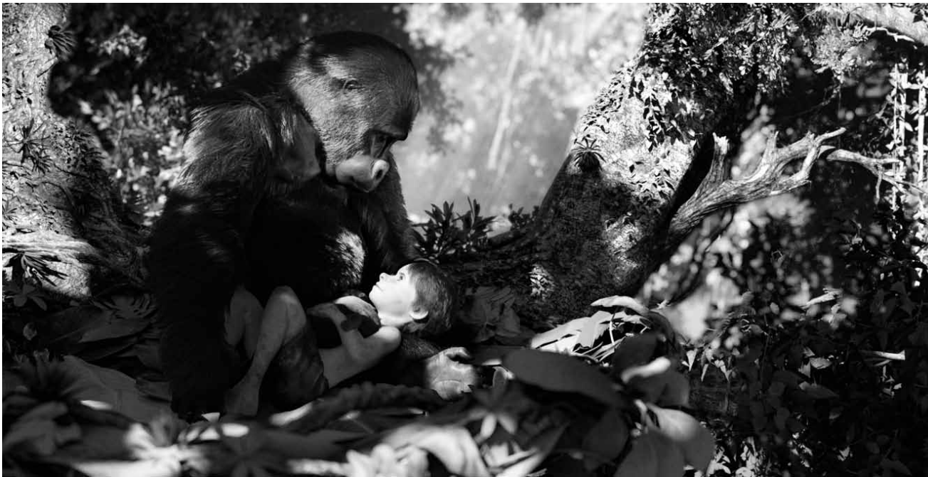
Die überverfilmte Legende von „Tarzan“ erwacht, aufs neue, zum Leben. Der 3D-Animationsfilm von Reinhard Klooss ist neu im Utopolis.