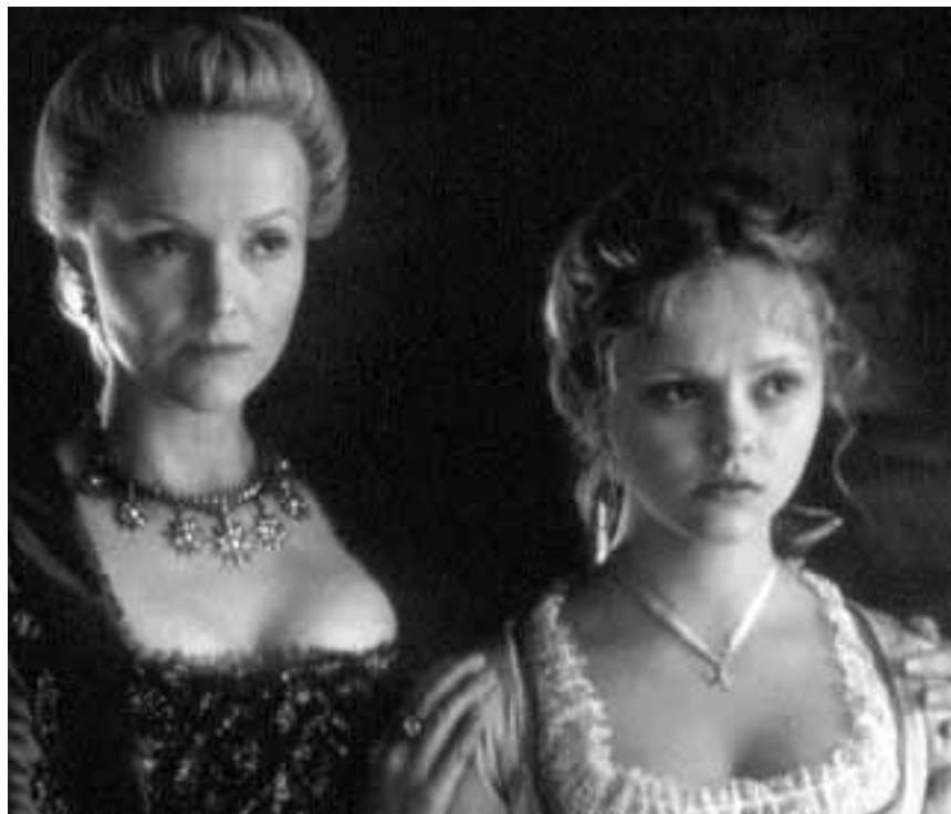
Le classique de la littérature anglaise « Sleepy Hollow » de Tim Burton est porté à l'écran dans le cadre du cycle de l'Université populaire du Cinéma à la Cinémathèque, ce lundi.