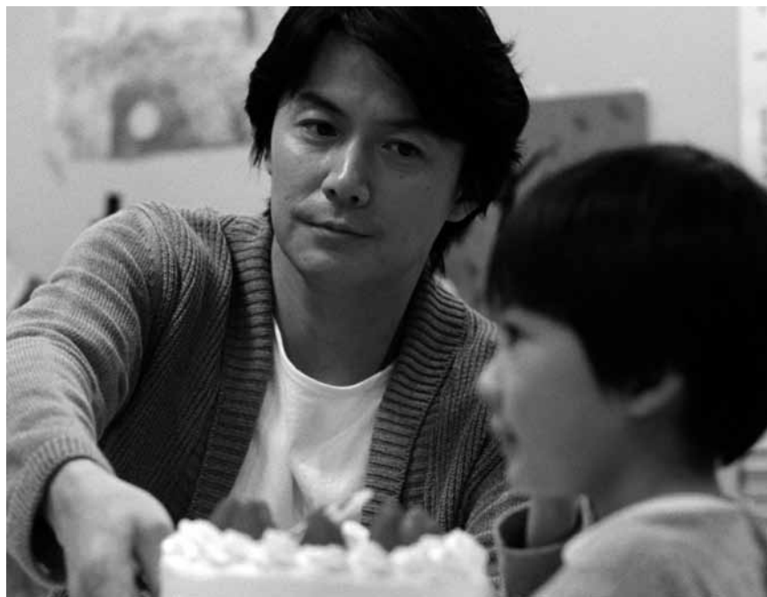
Hirokazu Koreedas Film „Like Father, Like Son“ stellt ganz poetisch Vaterschaft und Blutsverwandschaft in Frage. Der Gewinner des Preises der Jury in Cannes 2013 wird am Samstag und Sonntag, im Rahmen von „Asian's Masterpieces“, im Utopia gezeigt.