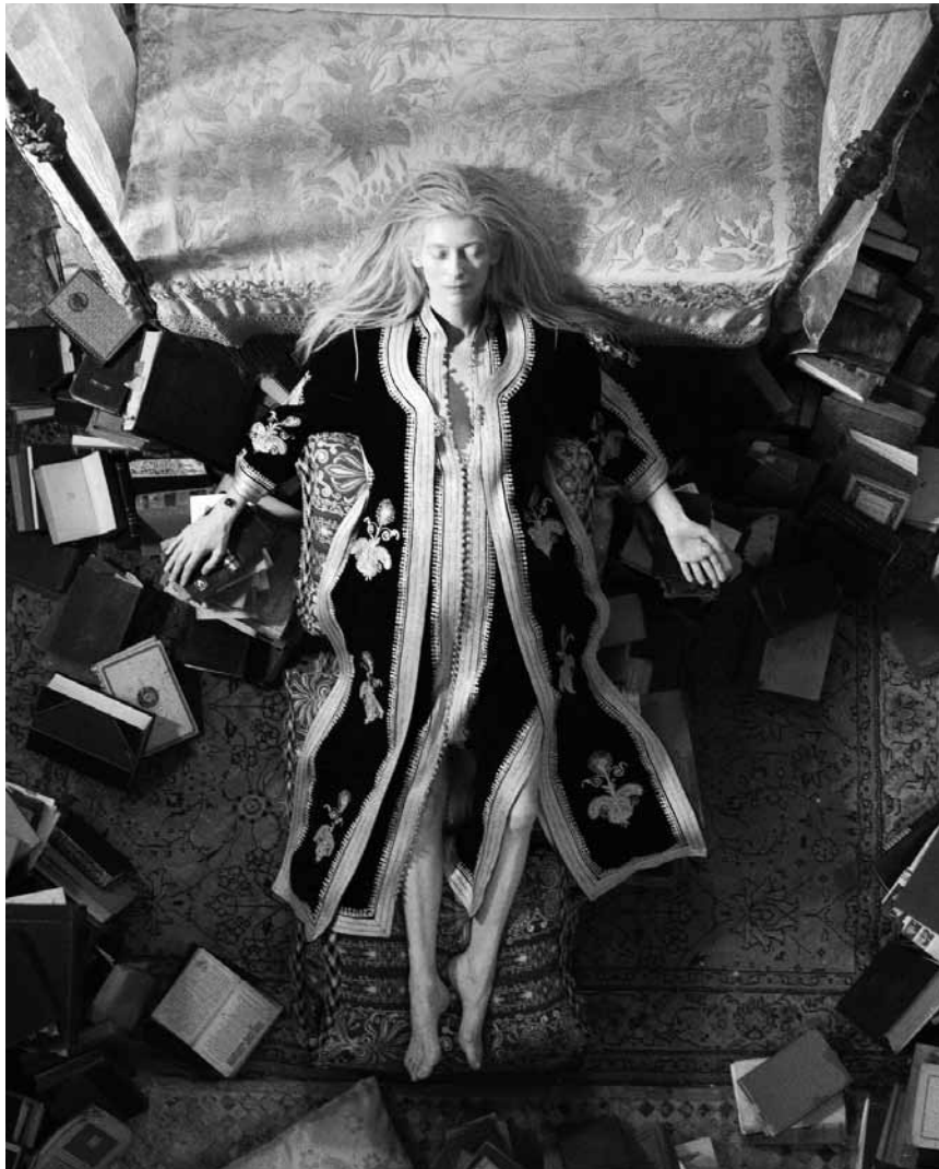
So eine Vampirin hat die Filmwelt noch nicht gesehen: Eve (Tilda Swinton) im Blutrausch.

Eine Fernbeziehung zwischen Detroit und Tanger mit Liebeserklärungen per I-Phone, Blutkonserven aus dem Krankenhaus und Blut-Eis am Stiel. „Only Lovers Left Alive“ ist ein Vampir-Liebesfilm in Zeiten der Globalisierung.