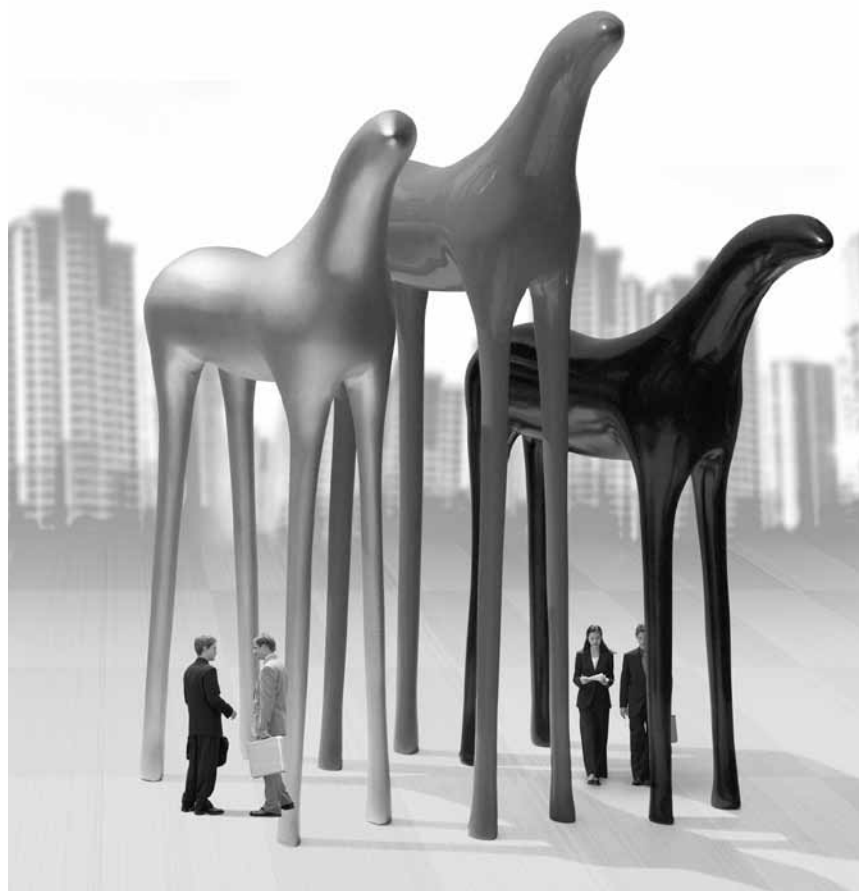
Un univers peuplé d'animaux étranges, aux limites de l'humain. Le monde merveilleux de Kostis Georgiou à découvrir du 1er au 23 mars à la chapelle du Centre culturel de rencontre abbaye de Neumünster.

Visite guidée pour enfants ce 2 : 14h30 (L/D) et le 9.3 : 14h30 (F).