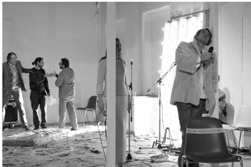
Nach dem Roman „Karte und Gebiet“ von Michel Houellebecq, interpretiert die Theatertruppe „Garage X“ das gleichnamige Stück im Ettelbrücker Cape, am 12. und 13. März.

Tout le monde sourit dans la même langue , soirée Millefeuilles, Club