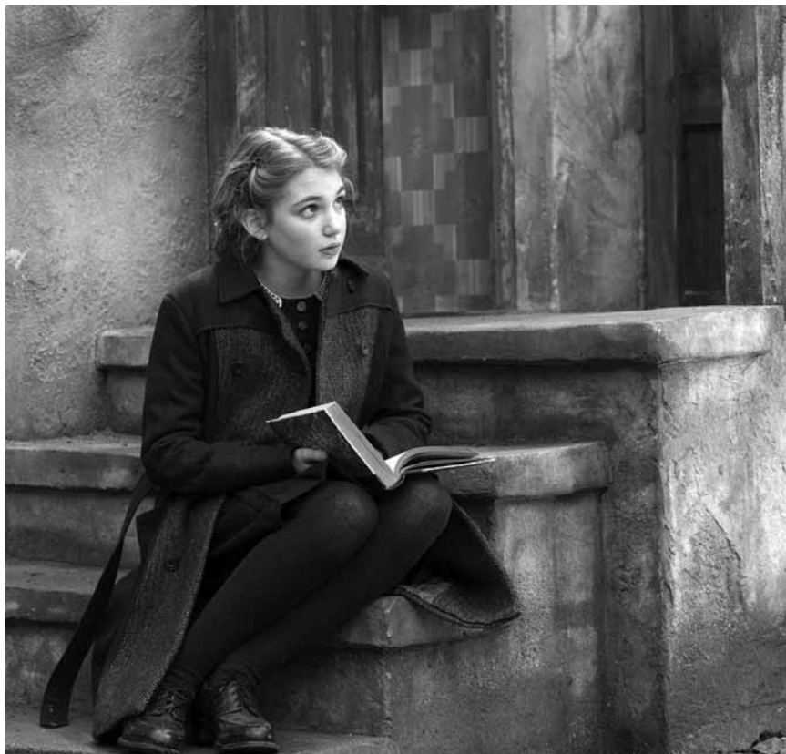
Eine Ehrerbietung an die Literatur: „The Book Thief“ von Brian Percival. Neu in Utopolis Kirchberg und Utopolis Belval.