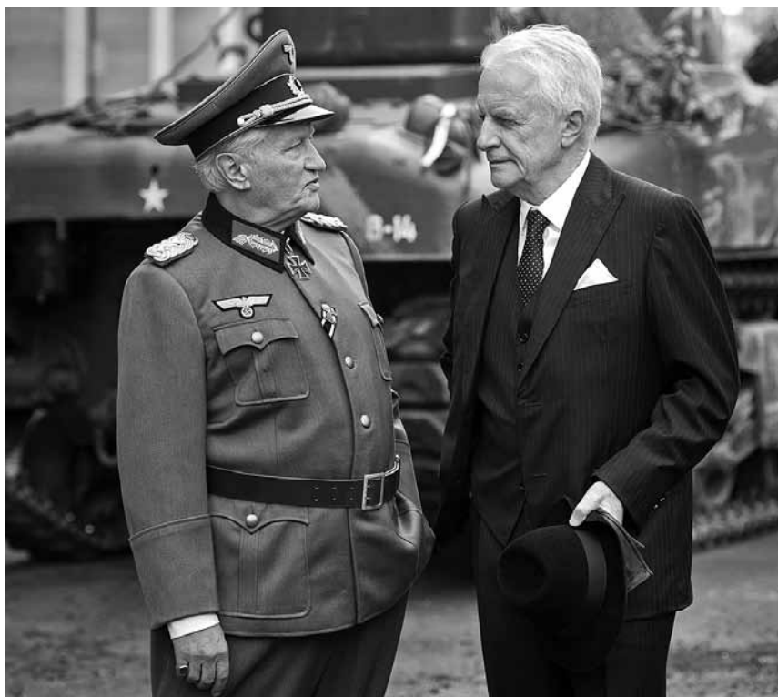
Le nouveau film de Volker Schlöndorff « Diplomatie » revient sur un rebond méconnu de la Seconde Guerre mondiale. A découvrir au Ciné-Breakfast et nouveau film à l'Utopia.

Der junge Jiro Horikoshi beschließt, dass er Flugzeuge bauen möchte, nachdem er in einem Traum dem italienischen Flugzeugingenieur Caproni begegnet und dieser ihm sagt, dass das Bauen von Flugzeugen weitaus schöner ist, als das Fliegen selbst. Während einer Zugfahrt begegnet er der hübschen Naoko mit der er sich Jahre später nach einem zufälligen Wiedersehen verlobt. Während Jiro über die Jahre als Chefentwickler für mehrere Unternehmen Kriegflugzeuge baut, hat Naoko mit gesundheitlichen Problemen zu kämpfen.