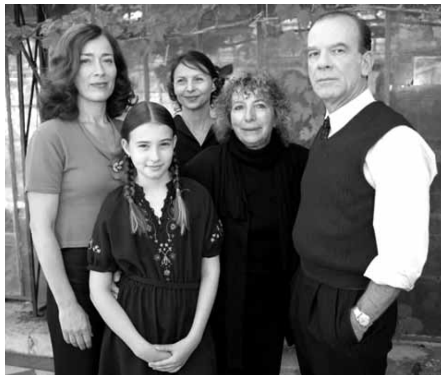
Die luxemburgische Koproduktion « Fieber » von Elfi Mikesch ist ein poetischer Film der einen Blick auf den Zusammenhang von Vergangenheit, Gegenwart und Zukunft in der Familie wirft. Neu im Utopia.

✘✘✘ Ce film est tout simplement une mise en abîme sur le choc entre notre « nature profonde » et les éléments extérieurs qui la façonnent, voire la contrarient. (David Wagner)