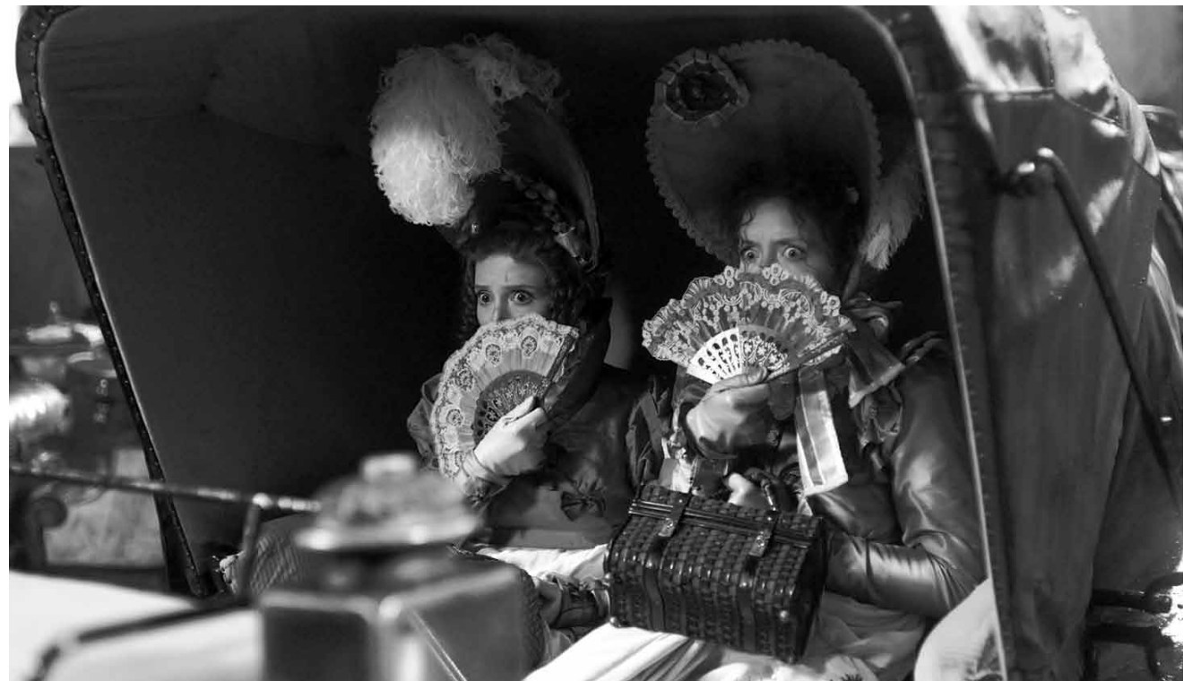
La légende renaît en haute définition. La nouvelle adaptation de « La Belle et la Bête » de Christophe Gans comblera tous les fans de contes de fées. A l'Utopolis Kirchberg.

XXX Un film qui fait rire et pleurer à la fois et qui vit aussi de ses excellents acteurs. (lc)