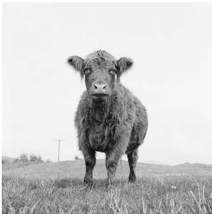
Die Fotografin Ursula Böhmer stellt ihre Kuh-Porträts in Clervaux aus. In „All Ladies - Kühe in Europa“ wird der Blickaustausch zwischen Tier und Mensch zur Hauptsache.