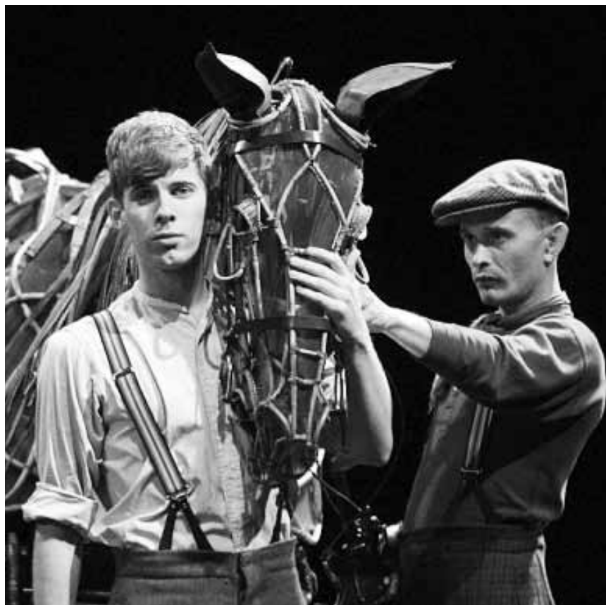
This Monday Utopia broadcasts "War Horse", a play adapted by Nick Stafford with astonishing life-size puppets brought to life by the South Africa's Handspring Puppet Company.