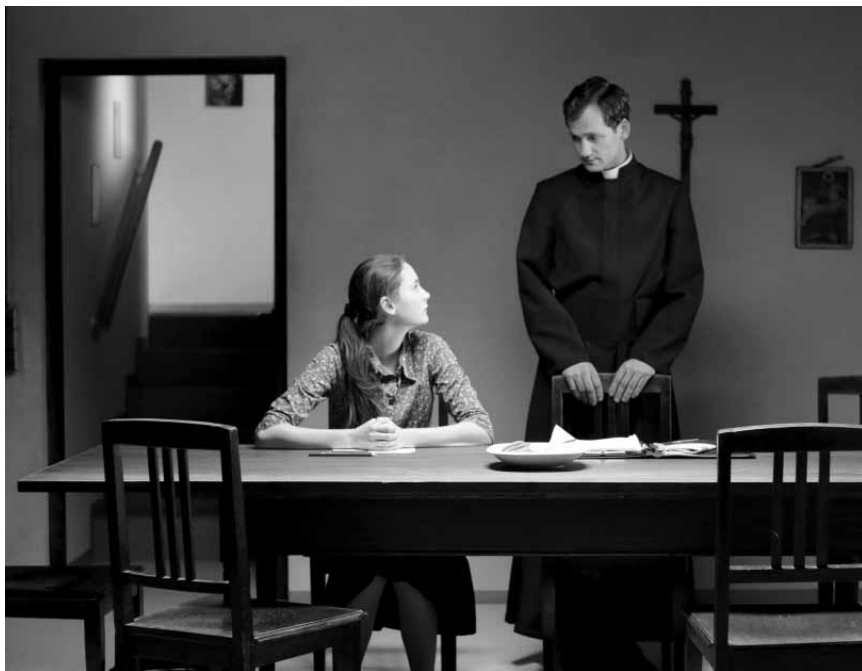
„Kreuzweg“ von Dietrich Brüggeman ist eine Gegenüberstellung von religiösem Fanatismus und der Freiheit der Jugend. Neu im Utopia.