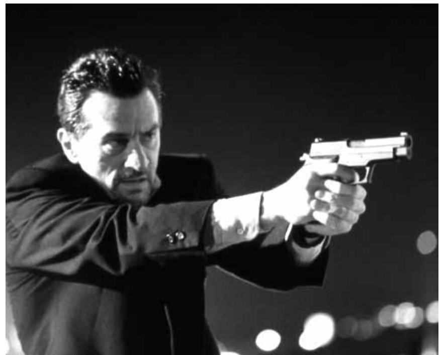
Le suspense du thriller « Heat » de Michael Mann, sorti en 1995 reste toujours aussi brûlant. Dans le cadre du cycle « Film and Popular Culture » à l'Utopia.

Während König Leonidas mit seiner Leibgarde an den engen Felsschluchten der Thermopylen die erste große Welle der Perserarmee abwehrt,