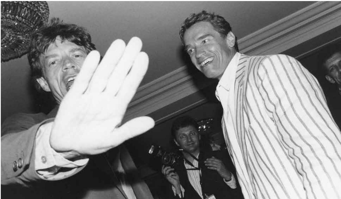
L'exposition « Paparazzi - stars et artistes » retrace un demi-siècle de photographies de stars et se penche sur le métier de chasseur d'images. A découvrir au Centre Pompidou Metz jusqu'au 9 juin.