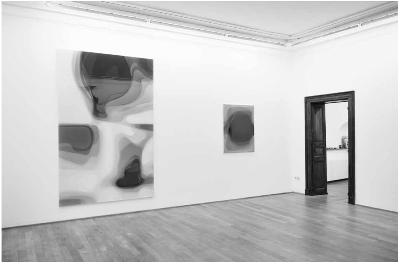
Wie durch ein Kaleidoskop ...