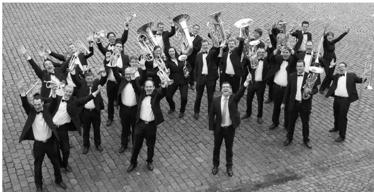
Die Brass Band Oberschwaben-Allgäu ist ein Ensemble ambitionierter Blechbläser und musiziert an diesem Samstag, dem 22. März im Mierscher Kulturhaus.

Amstel Quartet , oeuvres de Mozart, Brahms, Pärt, Glass, Franck et Nyman, Centre culturel Kinneksbond, Mamer,