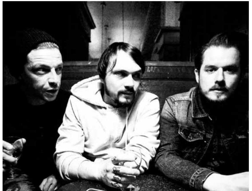
Le groupe de doom metal luxembourgeois « Soleil Noir » donnera un concert pour le moins mystique à l'Entrepôt à Arlon ce vendredi 21 mars.