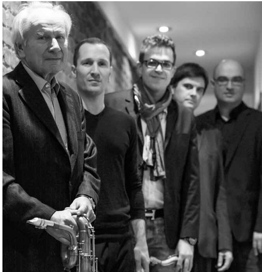
Die Groovin High Group um Professor Scheer spielt am 23. und am 29. März im Theater Leidinger vom Swing-Bebop über Jazz-Rock hin zu Cross-Over mit klassischer Musik zum größten Vergnügen der ZuhörerInnen.

Antonia: Travail, famille, poterie , Aalt Stadhaus, Differdange, 20h.