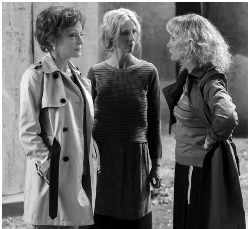
Quiiproquos, malentendus et situations emmêlées, voilà les ingrédients du dernier film d'Alain Resnais « Aimer, boire et chanter », nouveau à l'Utopia.