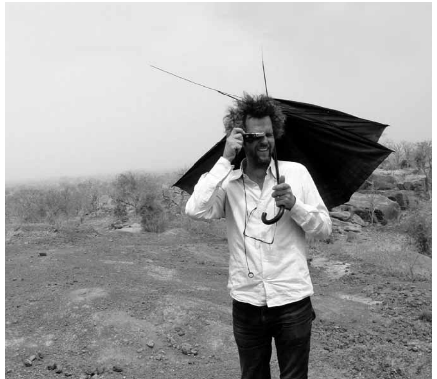
Wen kümmert Kunst wenn man nicht genug Wasser zum Überleben hat? „Knistern der Zeit“ dokumentiert das Schlingensiefel-Projekt vom Bau eines Operndorfs im Burkina Faso. An diesem Samstag im Sura.

Als Spion und Auftragskiller fand Ethan Runner nie die Zeit sich um