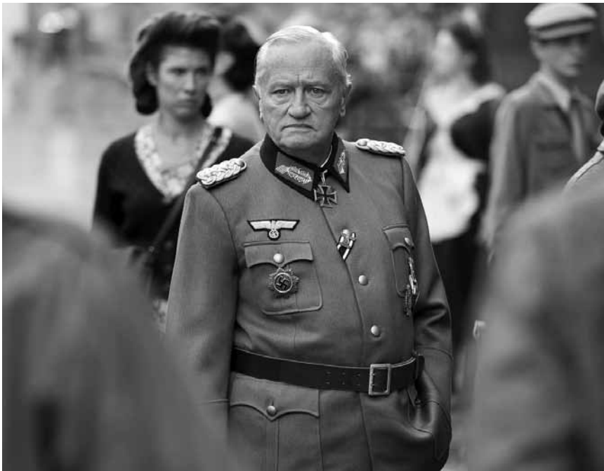
Kein fanatischer Nazi, sondern fast menschlich: Niels Arestrup in der Rolle des Generals von Choltitz.