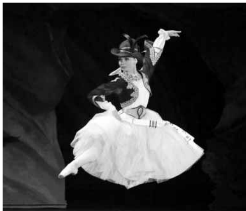
Ce dimanche, en transmission directe du Théâtre Bolchoï, Utopia propose le ballet en trois actes « Marco Spada ».

■■■■ = excellent ■■■ = bon ■■ = moyen ■ = mauvais