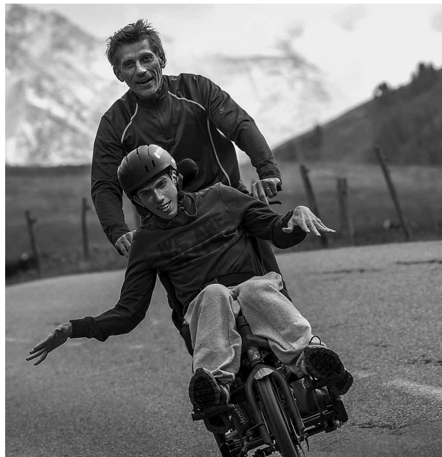
Rien n'est impossible quand on le veut vraiment. « De toutes nos forces » dresse un portrait touchant d'une relation père-fils. Nouveau à l'Utopolis Kirchberg.

Den Job des Air Marshall macht Bill Marks nicht gerne: Er hasst das Warten, die Verspätungen und das lange Sitzen im Flugzeug. Doch während eines Fluges von New York nach London ist plötzlich Action an Bord. Marks erhält eine Textnachricht, aus der hervorgeht, dass alle 20 Minuten ein Passagier des Flugzeuges getötet wird, sollte der Air Marshall nicht 150 Millionen Dollar auf ein Konto überweisen.