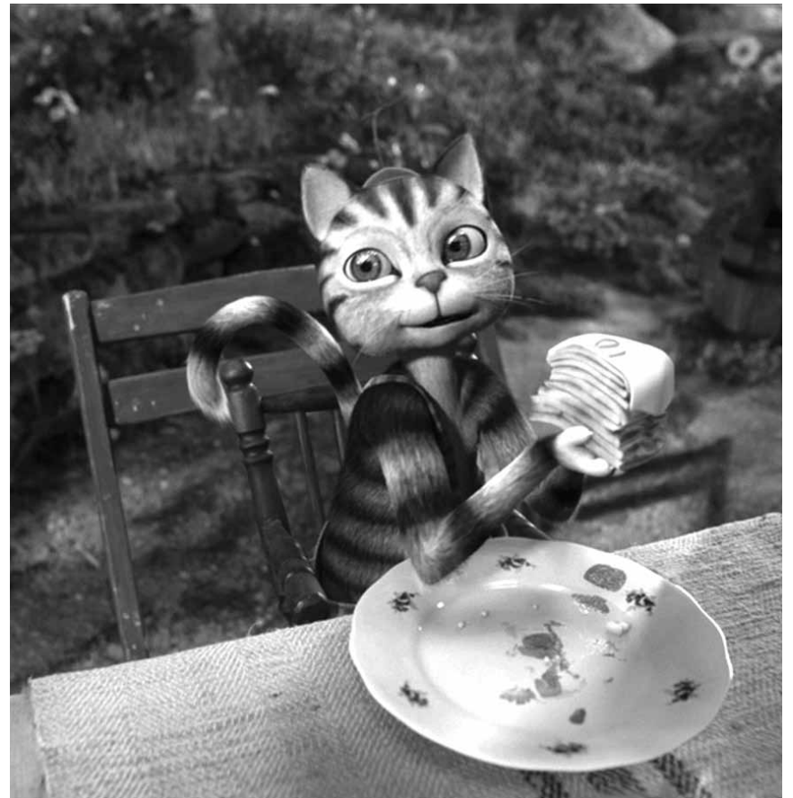
Für die Kleinen: „Pettersson und Findus - Kleiner Quälgeist, große Freundschaft“ ist ein Animationsfilm mit echten Schauspielern. Neu im Ariston, Ciné Waasserhaus und Kursaal.

Emmet wird von Wyldstyle entführt, weil die denkt, er sei eine Art Messias. Er soll ihr dabei helfen einen Bösewicht zu stoppen, der die Welt zerstören möchte.