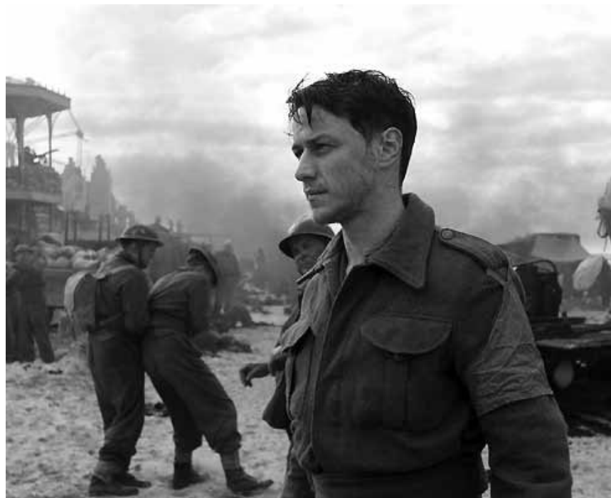
Eine Lüge provoziert eine Kettenreaktion mit schweren Konsequenzen. „Atonement“ am Samstag in der Cinémathèque.

L'action se déroule aux États-Unis dans les années 1970. Frère Lapin, Frère Ours et le Prêtre Renard quittent le Sud pour venir s'installer à Harlem.