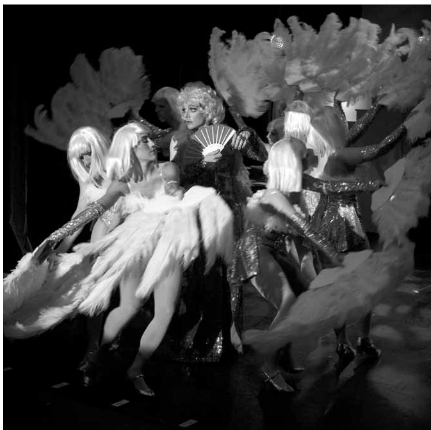
Frei nach dem französischen Klassiker, wird am Freitag, dem 4. April bei „Ein Käfig Voller Narren“ im Cape in Ettelbrück kein Auge trocken bleiben.