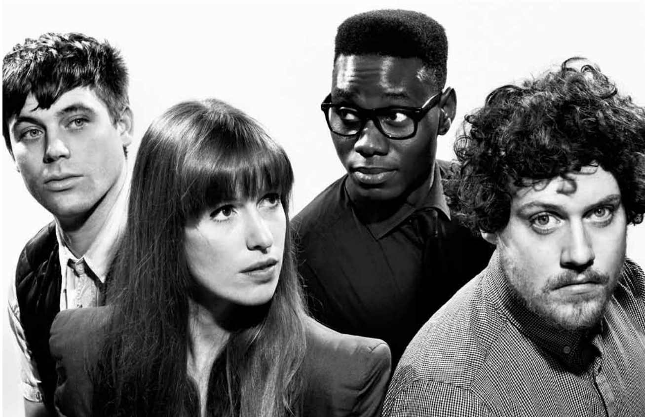
Haï ou adulé, Metronomy restera toujours un groupe hors pair.