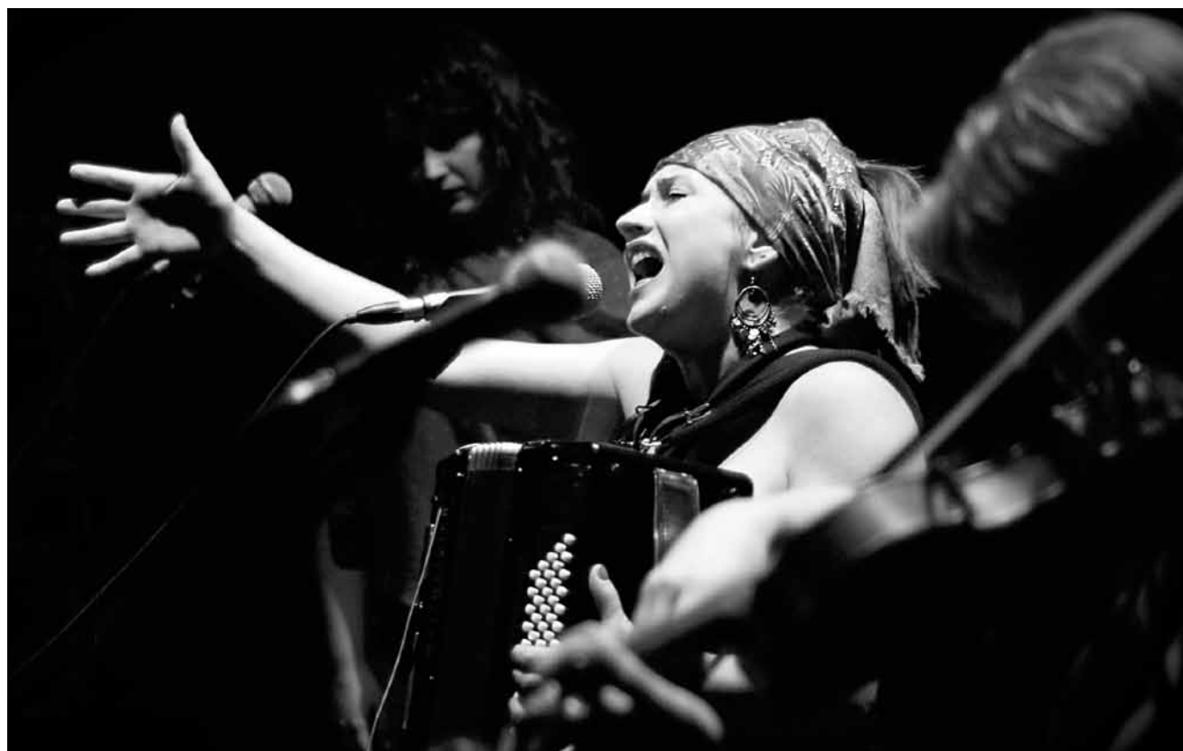
Le groupe « Dikanda », dont le nom signifie « famille », vous fera entrer dans leur monde musical cosmopolite aux sonorités envoûtantes le vendredi 4 mars à l'abbaye Neumünster.

Éierens an Néierens , Kaméidistéck vum Wolfgang Binder, mam Déifferdenger Theater, Theatersall (rue Jean Gallion), Oberkorn, 20h. www.tmd.lu oder Tel. 691 61 65 87.