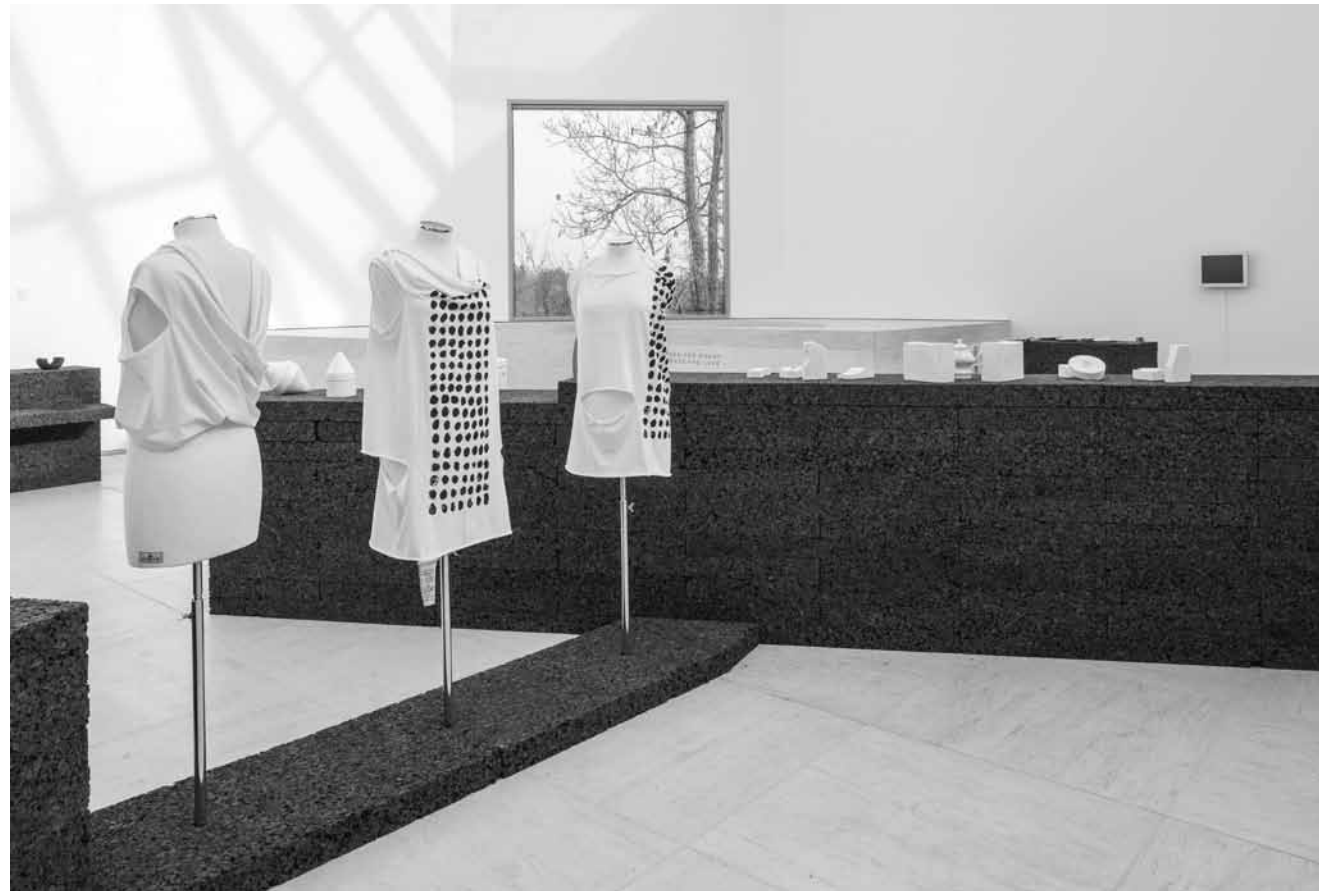
Really? „Never for Money, Always for Love“ zeigt die Werke aus „Design City 2014 - LXBG Biennale“, bis zum 15. Juni im Mudam.

peintures, Galerie Clairefontaine Espace 1 (7, place Clairefontaine, tél. 47 23 24), jusqu'au 26.4, ma. - ve. 14h30 - 18h30, sa. 10h - 12h + 14h - 17h.