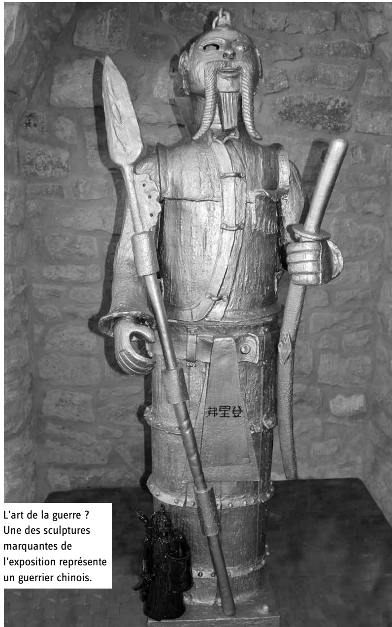
L'art de la guerre ? Une des sculptures marquantes de l'exposition représente un guerrier chinois.