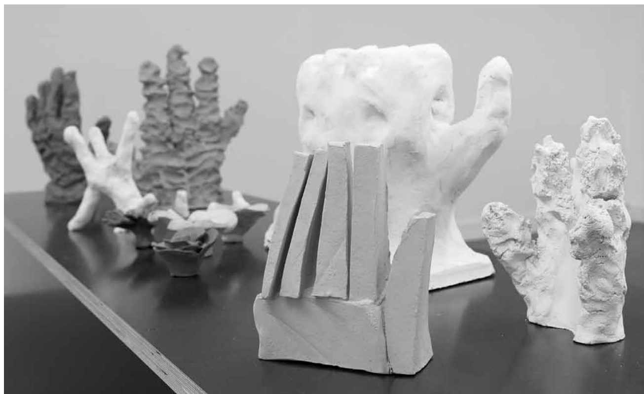
Ne pas oublier : l'exposition « Keep your Feelings in Memory » sera au Musée de la Résistance d'Esch jusqu'au 24 avril.

peintures, Galerie Schlassgoart (blv. Grand-Duchesse Charlotte, tél. 26 17 52 74), jusqu'au 19.4, ma. - di. 15h - 19h.