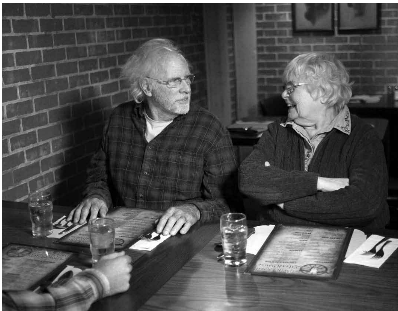
Une belle tranche de vie.