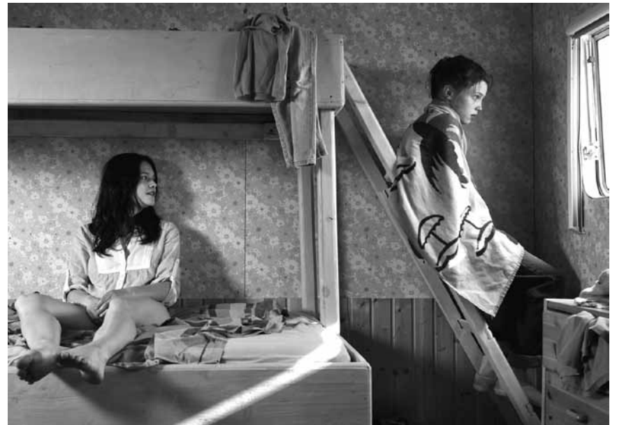
Dans « Puppy Love », les drames de l'enfance et de l'adolescence se croisent. Nouveau à l'Utopia.

Lorsque le médecin Colin apprend par mégarde à sa femme Kathryn que les jours de son patient George Riley sont sans doute comptés, il ignore que celui-ci a été le premier amour de