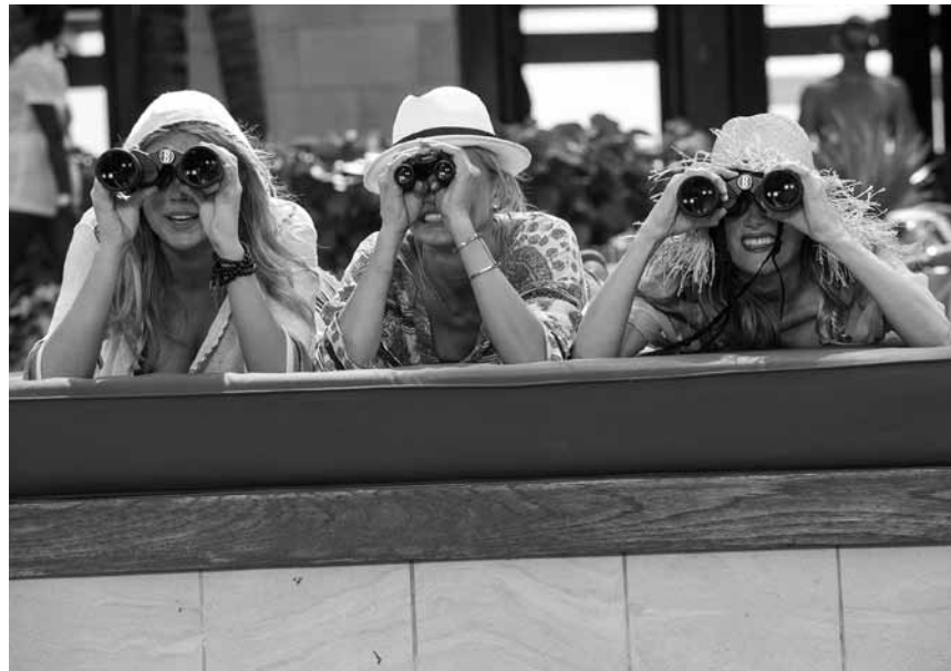
Drei verletzte Frauen wollen einem Macho den Garaus machen: „The Other Woman“, neu im Le Paris, Orion, Prabbeli, Starlight, Sura, Utopolis Belval und Kirchberg.

Kelly und Mac Radner sind ein leicht spießiges Ehepaar, das mit seinem Baby in einer beschaulichen Vorstadtsiedlung wohnt. Die Radners lieben die Ruhe in ihrer netten Nachbarschaft und begrüßen Neuankömmlinge mit offenen Armen. Doch als in das Haus nebenan eine feierwütige Studentenverbindung einzieht, ist es vorbei mit dem Frieden.