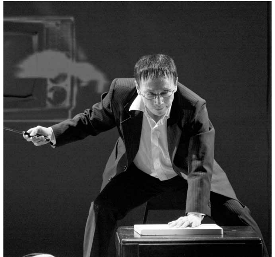
La spirale de la violence qui se déchaîne à la suite d'événements apparemment quotidiens est au centre de « The Bee », pièce de théâtre de Hideki Noda - au Grand Théâtre, le 27 mai.