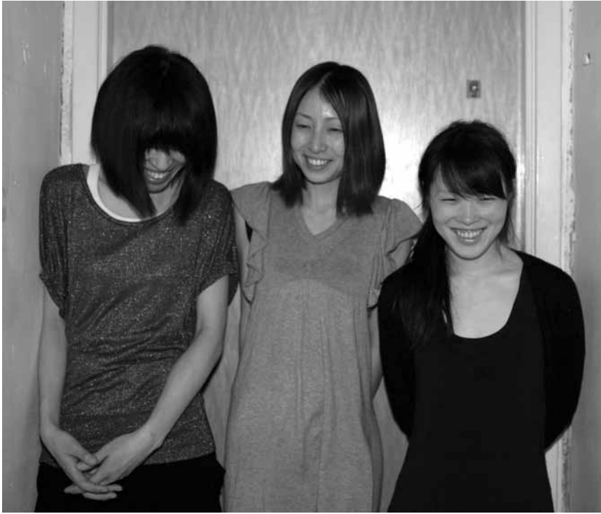
Die drei Frauen von Nisennenmondai haben es faustdick hinter den Ohren: Ihren experimentellen Krautrock feuern sie am 29. Mai im Exit07 auf unsere Trommelfelle ab.

The Best of Film & Musical , avec l'ensemble Estro Armonico, le groupe L's Just For Jazz Band, direction: Werner Eckes, Centre des arts pluriels Ed. Juncker, Ettelbruck , 20h. Tél. 26 81 21-304.