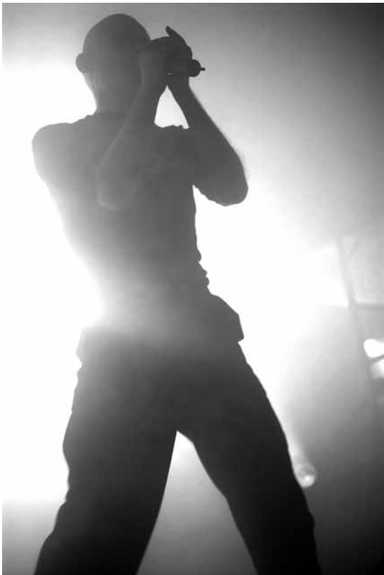
Personnage culte de la scène gothique sans le vouloir : Andrew Eldritch des Sisters of Mercy.