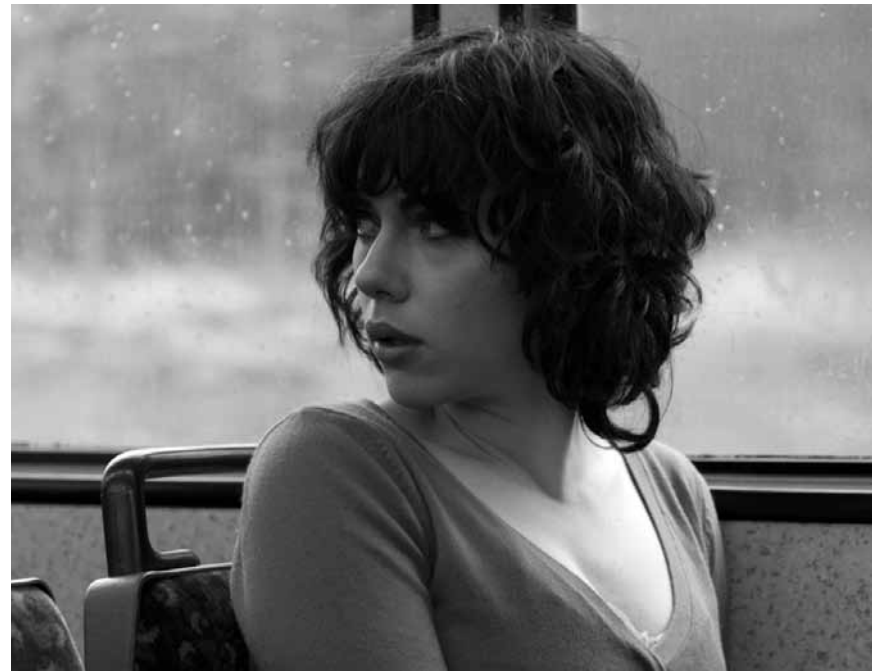
Scarlett Johansson als männermordendes Biest - diesmal wortwörtlich zu nehmen: „Under the Skin“, Ciné Breakfast am Sonntag im Utopia.

Schafzüchter Albert ist nicht das, was man sich in unter einem echten Cowboy vorstellt. Er hat noch nie einen Colt abgefeuert und geht jeder Schlägerei aus dem Weg. Darum flüchtet Freundin Louise schon bald in die Arme eines richtigen Cowboys. Albert ist zutiefst niedergeschlagen, bis eines Tages die bildhübsche Anna auftaucht. Er verliebt sich in die toughste Blondine, und mit seinen Gefühlen keimt auch neuer Mut in ihm auf. Den hat er bitter nötig, denn Annas Gatte ist ein skrupelloser, schießwütiger Bandit.