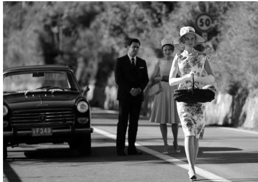
Prunkvolle Kostüme, reduzierte Handlung. Grace von Monaco (Nicole Kidman) und ihr Gatte Fürst Rainer III. (Tim Roth).

Im Vorfeld hatte es allerdings gewaltig rumort: Nicht nur wurde der Starttermin wegen Streitereien zwischen Regisseur und Produzenten um die endgültige Fassung wieder und wieder verschoben, auch das Fürstenhaus schmolte und blieb demonstrativ der Premiere fern, ja rief sogar zum Boykott auf, sah es doch seine Familienehre durch den Film beschmutzt. Irgendwie auch kein Wunder, denn ähnlich wie einst in seinem Biopic über Edith Piaf ( La vie en rose , 2007) zeichnet Regisseur Olivier Dahan auch hier das Bild einer widerspenstigen und lebenshungrigen Frau, die durch äußere Umstände in ein Korsett gezwungen wird. Grace will sich anfangs den Gepflogenheiten bei Hofe nicht anpassen und fristet so ein frustriertes Dasein. Die Schauspielerei fehlt ihr, und bei offiziellen Anlässen sagt sie unverblümt ihre Meinung, prangert etwa gegenüber Briten den Kolonialismus als mittelalterlich an oder erklärt bei ihrer karitativen Tätigkeit beim Roten Kreuz die Renovierung eines Heims für wichtiger als den alljährlichen Charity-Ball. Ein Vogel im goldenen Käfig, dem man die Flügel gestutzt hat. Wegen ihrer mangelhaften Französischkenntnisse ist sie auch nicht bei der heimischen Bevölkerung akzeptiert und wirkt bei öffentlichen Auftritten arrogant und gestelzt. Als Alfred Hitchcock ihr die Hauptrolle in dem Film „Marnie“ anbietet, der von einer Kleptomantin handelt, erscheint ihr das Angebot als der letzte Ausweg aus der Isolation. Doch da eine Rückkehr zur Schauspielerei den Ruf