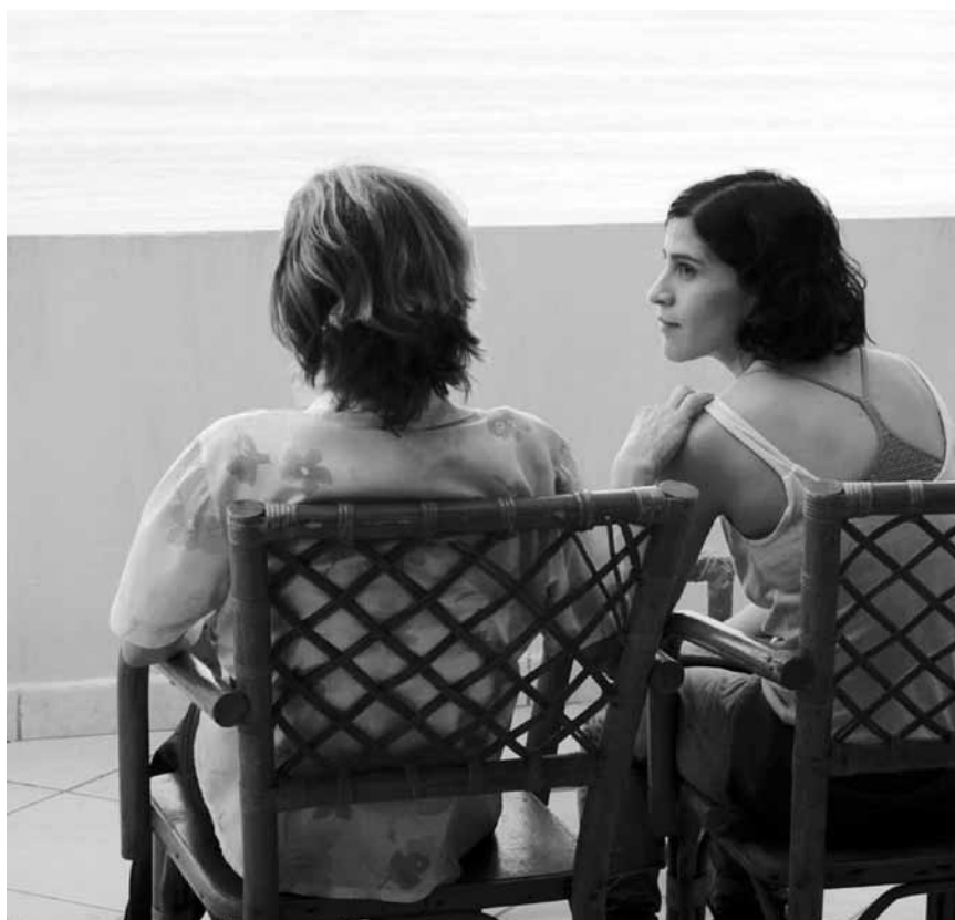
Une histoire d'amitié sur fond de maladie : « Los insolitos peces gato », nouveau à l'Utopia.

avec chaque membre de la famille se renforce jour après jour.