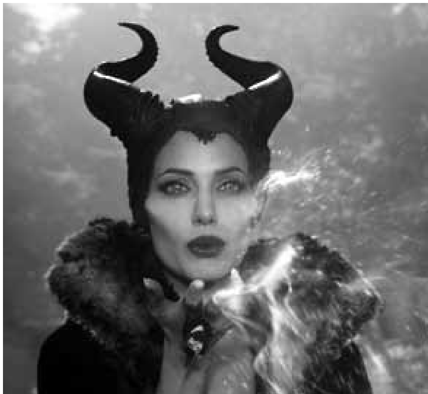
Disney kramt die böse Hexe mal wieder aus der magischen Schublade hervor: „Maleficent“, neu in den Kinos.

filles, coule des jours heureux dans les Alpes avec sa nouvelle compagne. Il va voir sa vie basculer le jour où son meilleur ami va tenter de le réconcilier avec sa famille en leur racontant un gros mensonge.