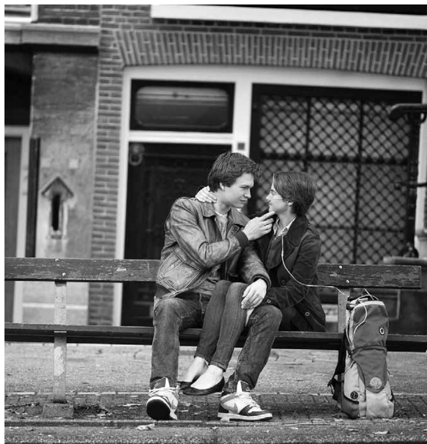
Der Krebs besiegt vielleicht das Leben, aber nicht die Liebe: „The Fault in Our Stars“, Ciné Breakfast, am Sonntag im Utopia.

USA/F 2014 de Pascale Ferran. Avec Josh Charles, Radha Mitchell et Mathieu Amalric. 127'. V. fr. + angl., s.-t. fr. + nl. A partir de 12 ans.