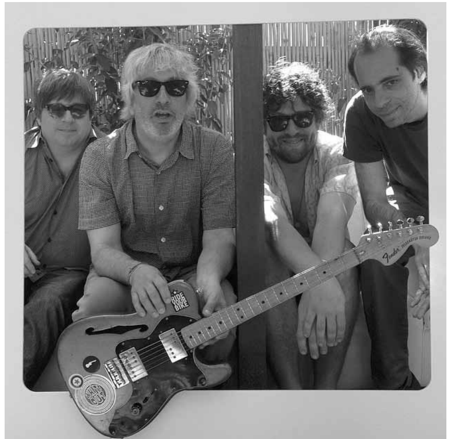
La guitariste Lee Renaldo - du groupe mythique Sonic Youth - sera à l'Entrepôt d'Arlon ce vendredi 6 juin et y emmènera son deuxième projet The Dust.