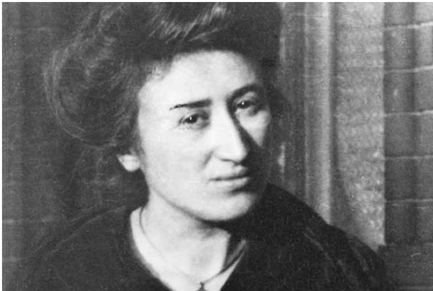
Zur Gallionsfigur stilisiert ...