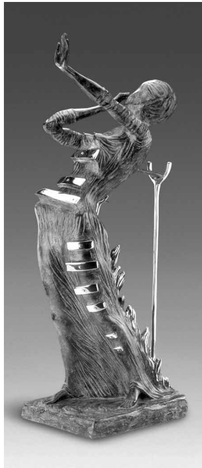
Tout feu et tout flamme et tout pour la femme : une sculpture de Salvador Dalí.