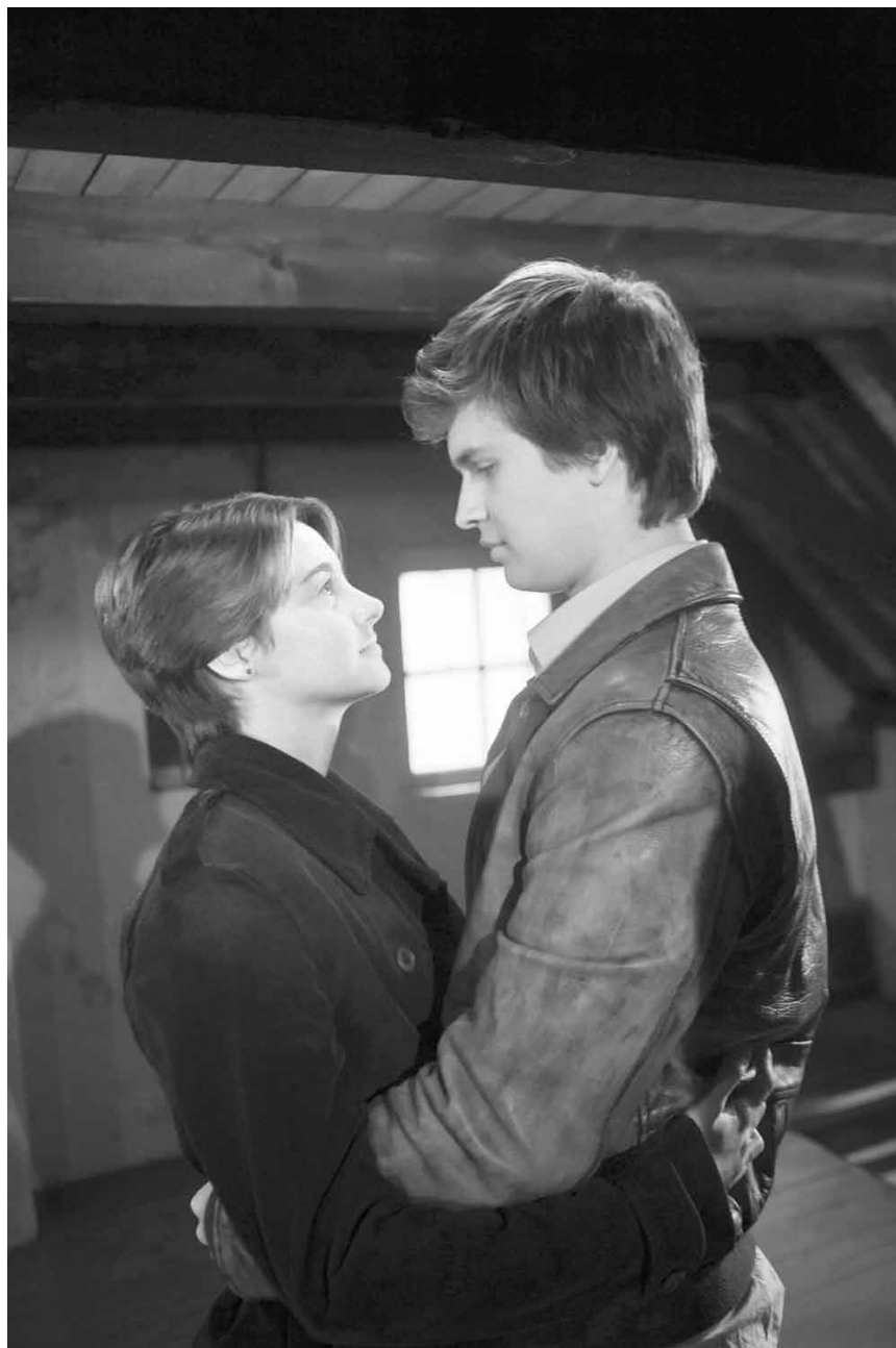
„The Fault in Our Stars“ - John Greens erfolgreiches Jugendbuch hat es auf die Leinwand geschafft - Vorpremiere am Freitag und am Samstag im Utopolis Belval und Kirchberg.

Starlight, ve. 21h., sa. + ma. 18h30, di. 16h.