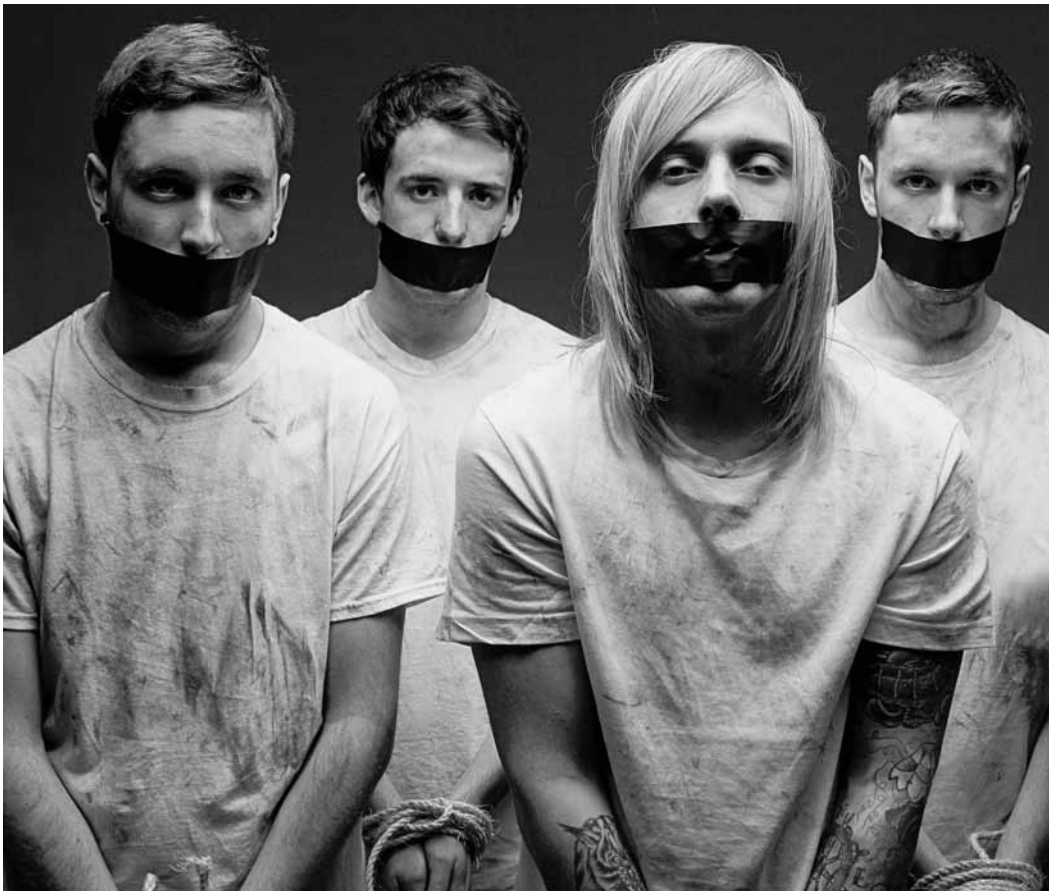
Constructeurs d'ultraviolence sonique durable : Architects.