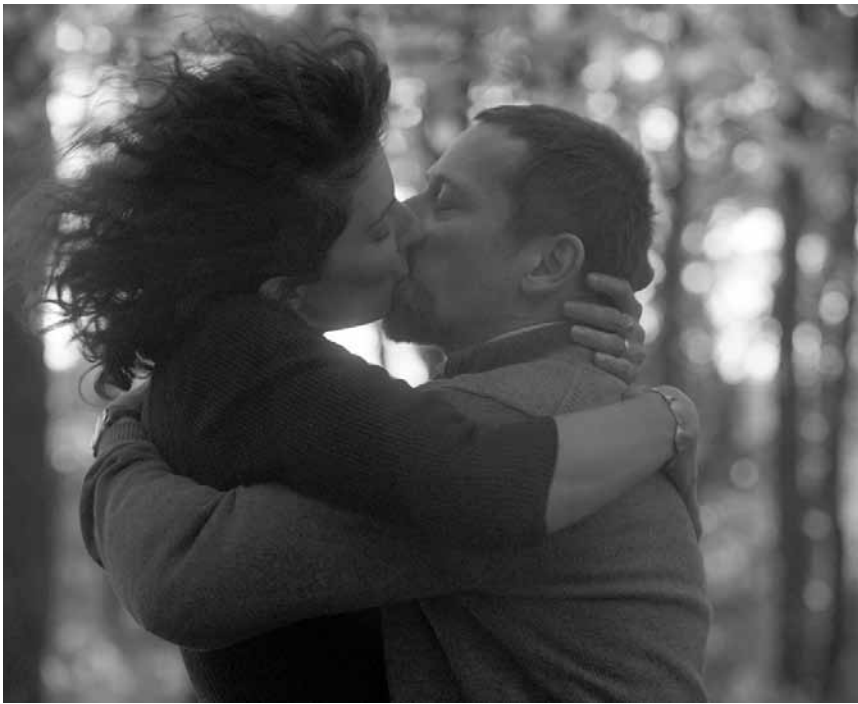
Amour, intrigues et poison : « La chambre bleue », d'après le roman de Georges Simenon. Nouveau à l'Ariston et au Ciné Waasserhaus.

zu Stein, womit sie nicht nur ihr Heimatland verlor, sondern auch ihre Güte.