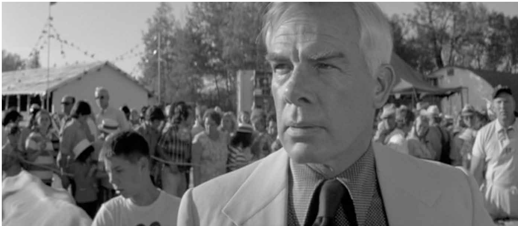
Un film où des gangsters, des saucisses et des orphelines jouent un grand rôle : « Prime Cuts » avec Lee Marvin et Gene Hackman, samedi à la Cinémathèque.

Im Dschungel ist die Welt noch in Ordnung, und Hugo, ein wonniges kleines Pelzknäuel, lebt sorglos in den warmen Tag hinein. Bis zu dem Moment, als eine exaltierte Filmdiva auftaucht und Jagd auf die niedliche Mischung zwischen Koala und Teddybär macht. Hugo flüchtet vor der bösen Diva und begibt sich auf eine abenteuerliche Reise. Dabei landet der kleine Urwaldbewohner unfreiwillig in der Großstadt.