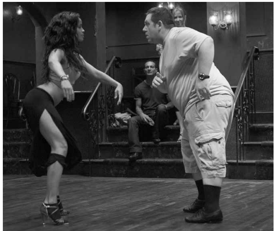
Trotz Frustspeck: Die Salsa-Leidenschaft hat ihn wieder gepackt. Nick Frost in „Cuban Fury“ - neu im Utopolis Kirchberg.