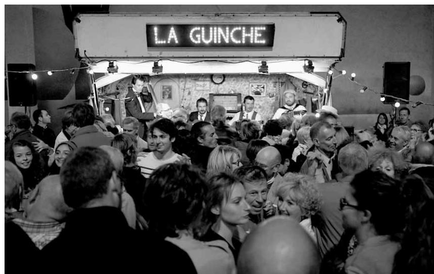
Ënnert dem Titel „Classy Times for Classy People“ gëtt de 4. a 5. Juli zu Esch-Sauer un Danzmusek aus den 1930er Joeren erënnert.

Tschick , von Wolfgang Herrndorf, sparte4 (Eisenbahnstr. 22), Saarbrücken (D) , 20h. www.sparte4.de