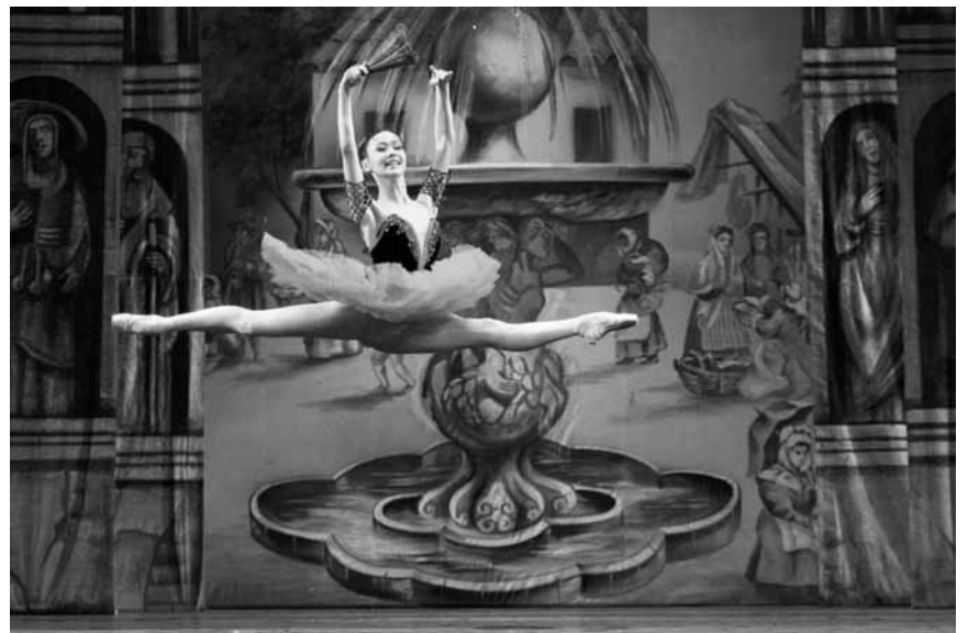
Sicher einen Sprung nach Wiltz wert: „Don Quixote“ getanzt vom Moscow City Ballet - am 28. Juni im Rahmen des 62. Wiltzer Festivals.