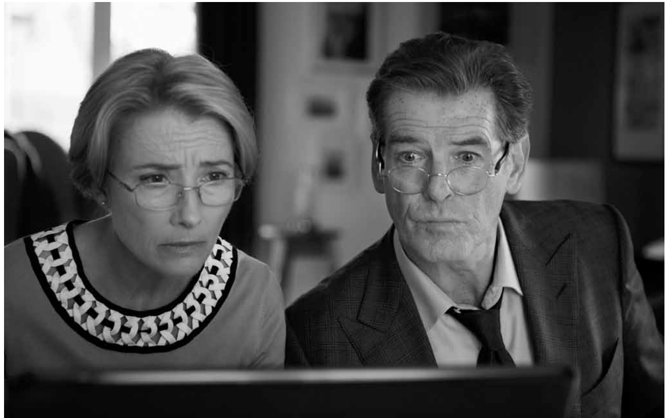
Geschieden und gehen trotzdem vereint gegen einen Betrüger vor, der sie um ihre Rente gebracht hat: „Love Punch“, neu im Utopolis Belval und Kirchberg.

Utopia, Fr. - So. 16h30 + 19h, Mo. + Di. 16h15 + 21h.