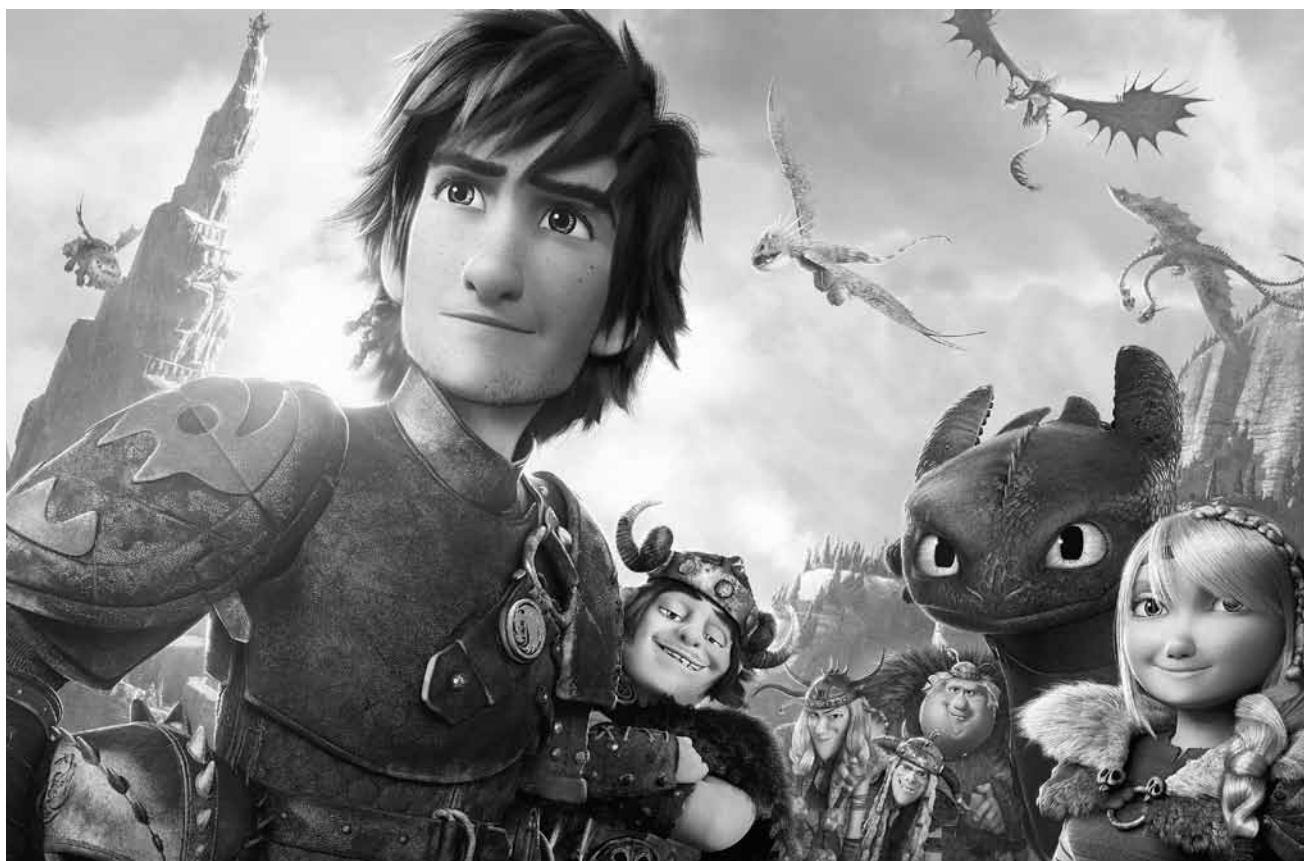
„How to Train Your Dragon 2“ - der Animations-Blockbuster für den Sommer läuft diese Woche in (fast) allen Kinos an.

Firmenübernahme keineswegs wie geplant abläuft: Er ist beim Verkauf einem Betrüger aufgesessen und von einem Tag auf den anderen pleite. Auch Richards Rentenrücklagen gehen mit seiner Firma unter. Um den unlauteren Geschäftsmann aufzuspüren, der für den Deal verantwortlich ist, tut sich Richard mit seiner Exfrau zusammen.