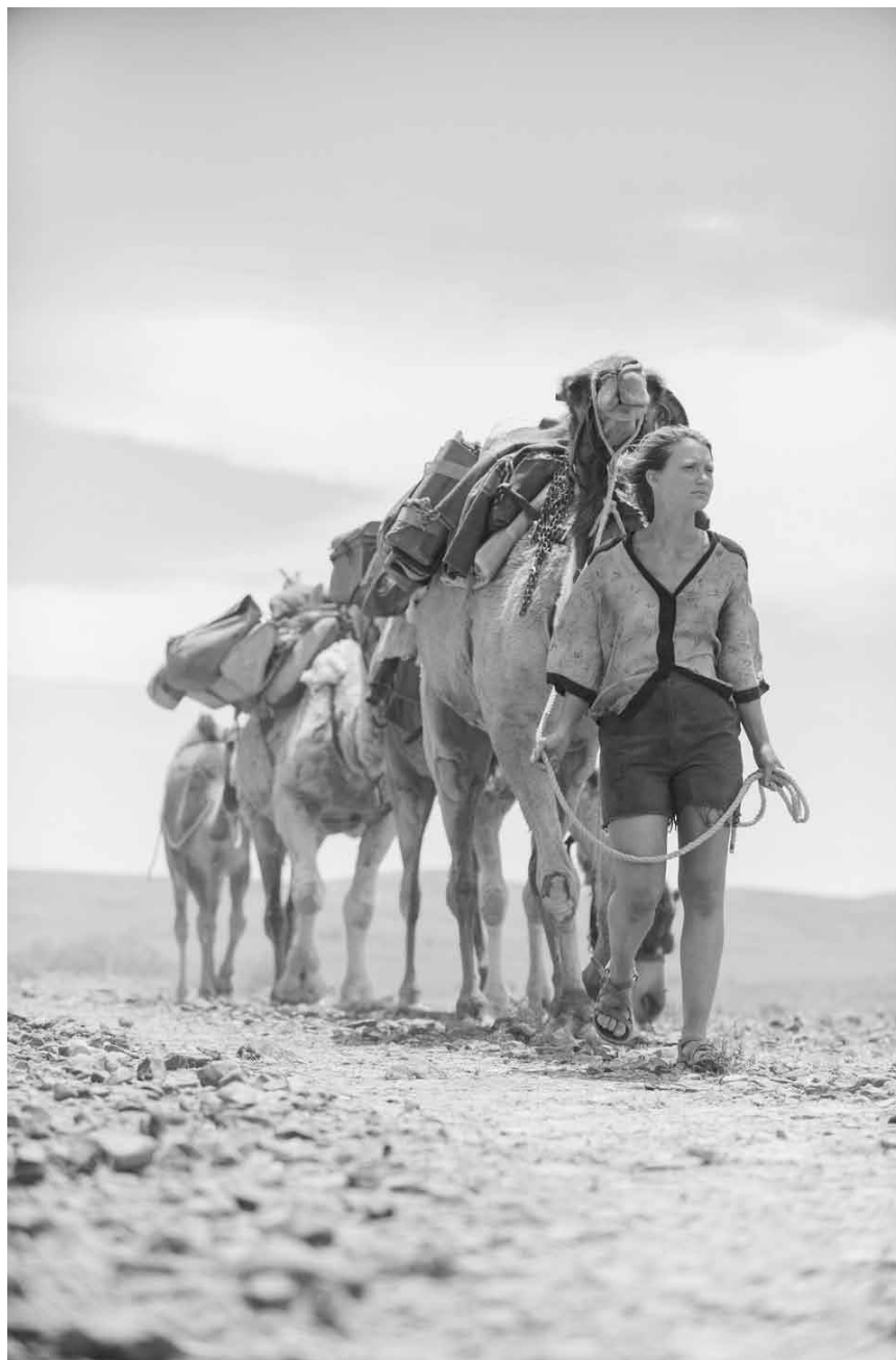
„Tracks“ erzählt die wahre Geschichte von Robyn Davidson, die sich 1977 aufmachte alleine die australische Wüste zu durchqueren - neu im Utopia.

Dr. Will Caster, führender Forscher im Bereich künstlicher Intelligenz, gelingt es nicht nur das kollektive menschliche Wissen in Maschinen zu übertragen, sondern diese auch mit menschlichen Emotionen auszustatten.