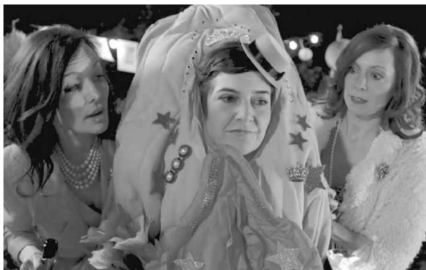
« Who's Afraid of Vagina Wolf » - est l'histoire d'une femme qui décide de se réinventer à la quarantaine, et un film sur le film en même temps. Avant-première dans le cadre du « Gaymat » ce mardi à l'Ariston.