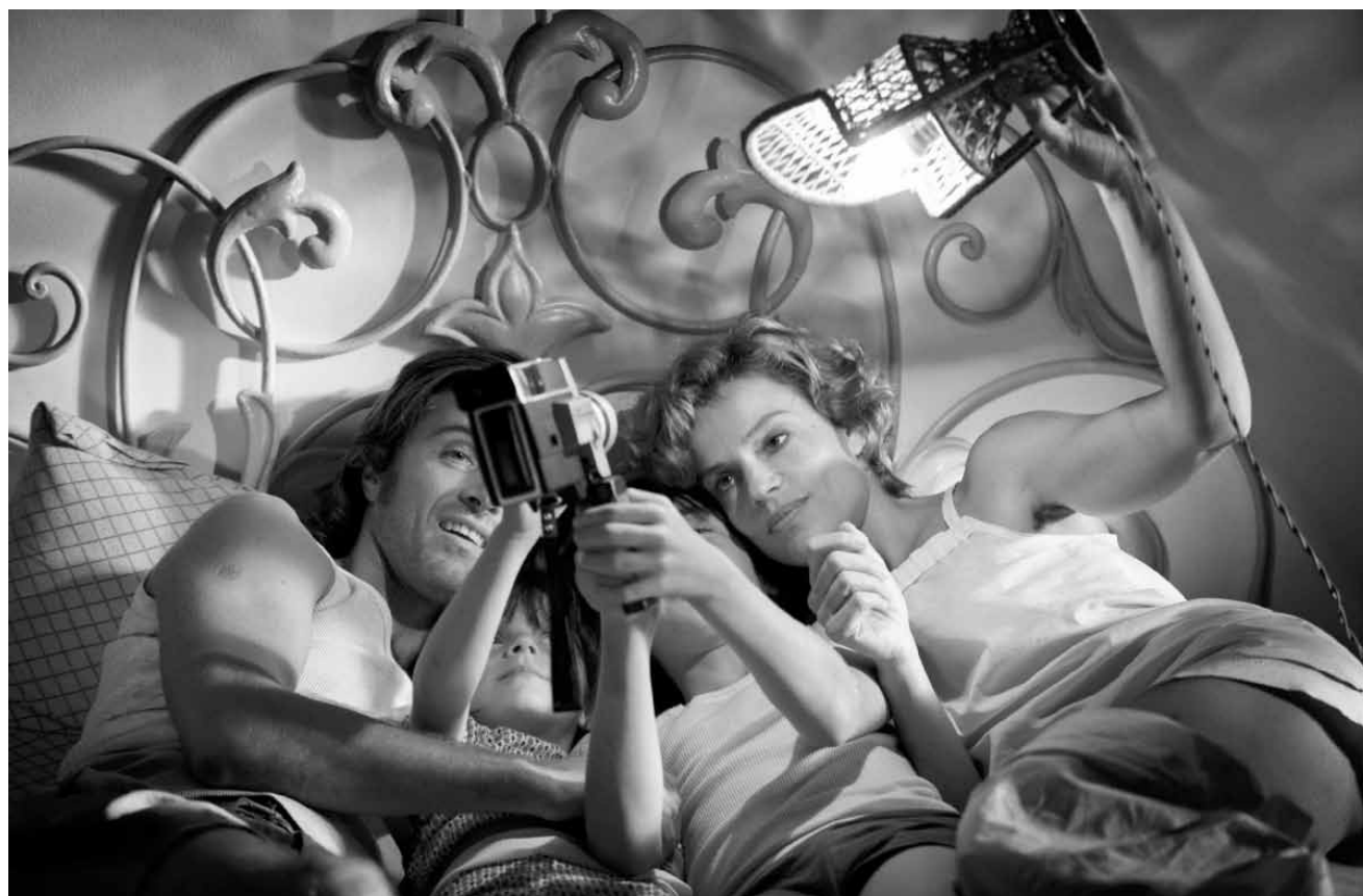
Un film sur la passion de créer et d'aimer, ainsi que sur ses contradictions : « Anni felici », nouveau à l'Utopia.

✘ Genrefilm der an Klassiker wie Saturday Night Fever, Dirty Dancing oder Strictly Ballroom aber leider nicht heranreicht. (cat)