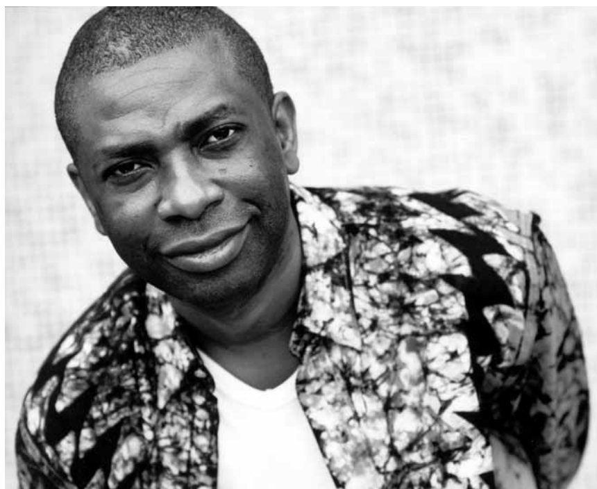
Youssou N'Dour, une des voix sénégalaises les plus connues internationalement, se produira lundi soir sur le parvis du Centre culturel de rencontre abbaye de Neumünster.

Das Sparschwein , Komödie von Eugène Labiche, Theater, Trier (D) , 20h. Tél. 0049 651 7 18 18 18.