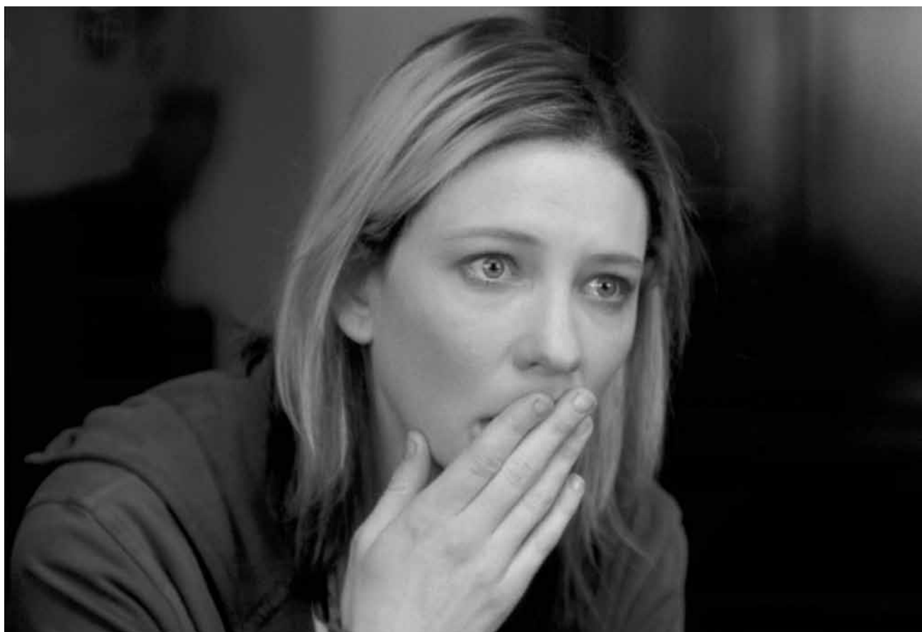
« Heaven » - l'histoire d'une revanche qui tourne court, par le metteur en scène de « Lola rent » , jeudi à la Cinémathèque.