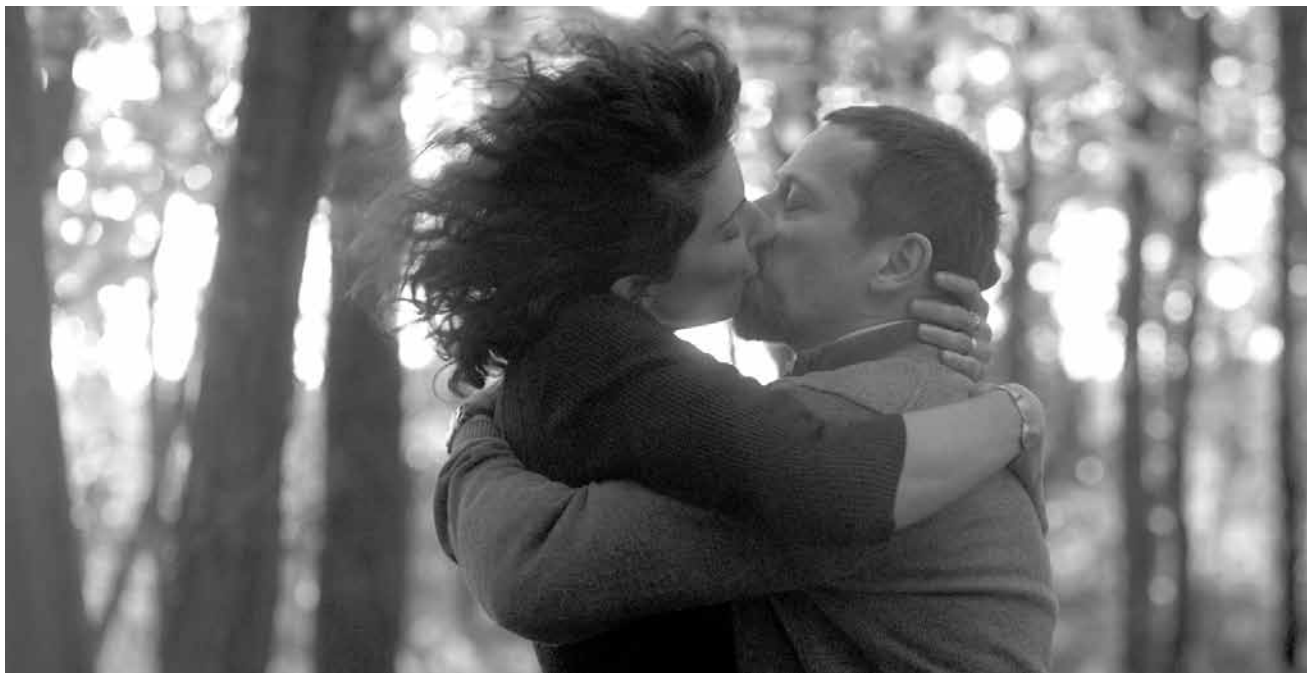
Femme fatale, amant manipulateur, les deux ou rien de tout cela ?