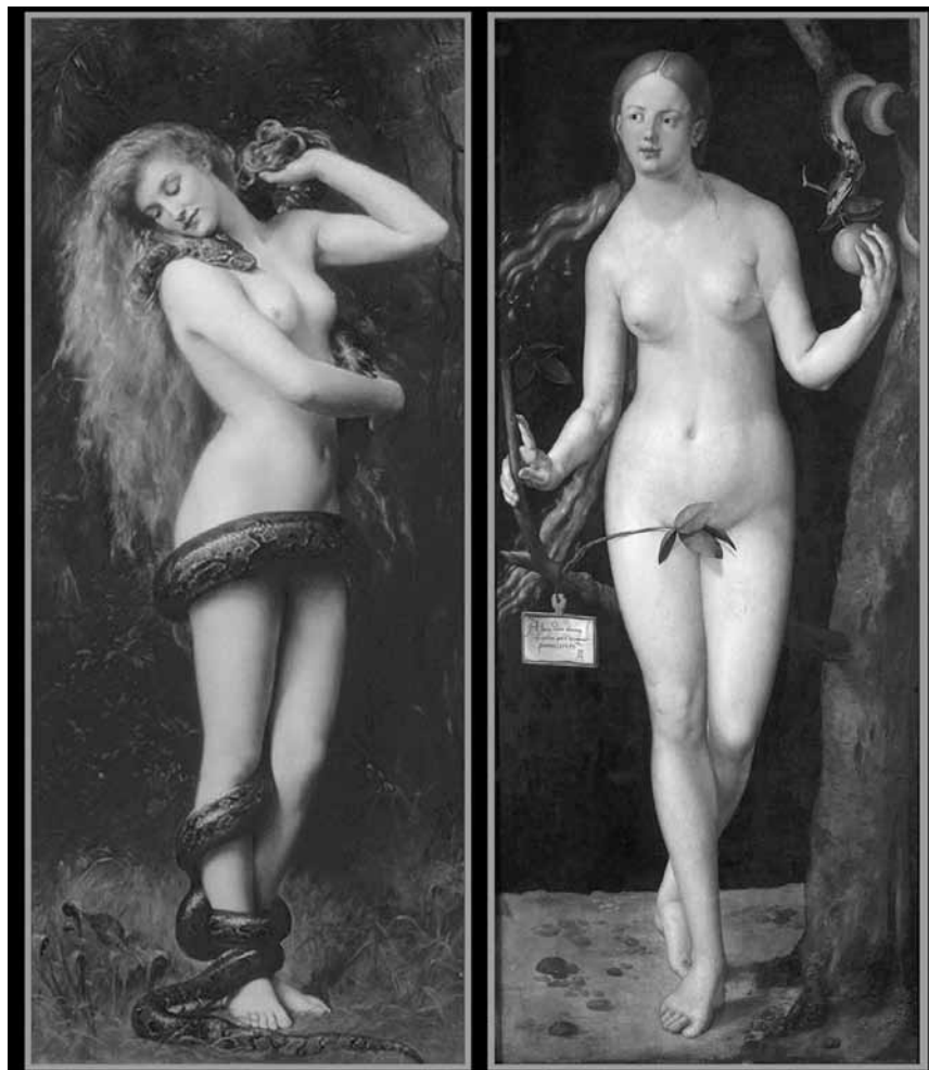
Und das ewig Weibliche zieht uns ... zur der Lesung „Lilith“ in der Kulturfabrik - am 11. Juli.