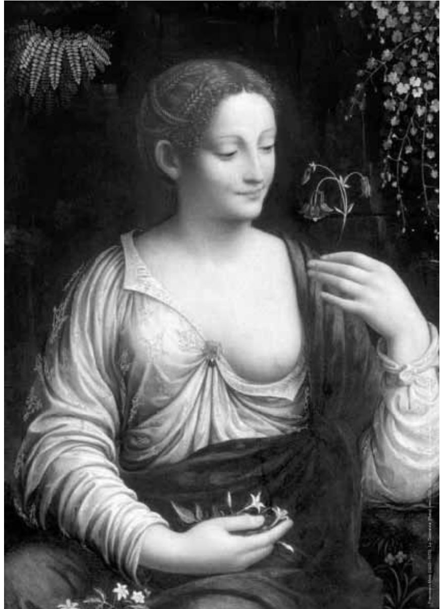
La collection de Guillaume II et de son épouse la tsarevna Anna Pavlovna est réunie pour une première fois depuis très longtemps dans la nouvelle exposition de la Villa Vauban: « Une passion royale pour l'art » - jusqu'au 12 octobre.